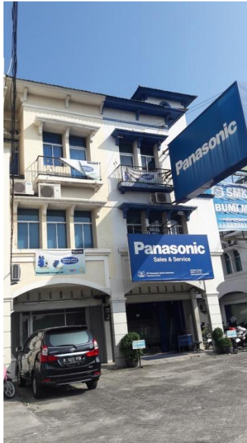
Gambar 1. PT PANASONIC GOBEL INDONESIA