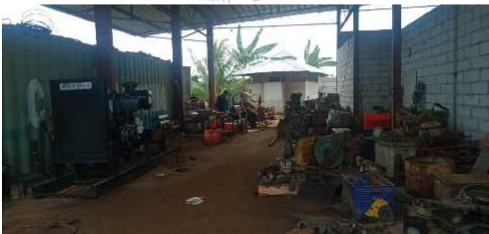
Gambar 1.7 Bengkel Mesin

Bengkel ini digunakan untuk sebagai tempat perbaikan mesin yang rusak mulai dari mesin kapal hingga mesin excavator . Adapun bengkel mesin seperti yang ditunjukkan pada Gambar 1.7.