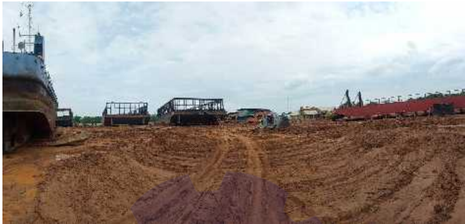
Gambar 1.8 Lahan Galangan

Lahan tanah lapang ini digunakan sebagai area penempatan tongkang dan tug boat yang naik dan akan diperbaiki sesuai kerusakan yang terjadi. Adapun lahan galangan seperti yang ditunjukkan pada Gambar 1.8.