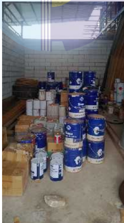
Gambar 1.5 Gudang Penyimpanan Cat

Gudang cat ini digunakan sebagai tempat penyimpanan persediaan berbagai jenis cat, warna cat dan tinner . Tujuan dari penempatan gudang cat ini adalah untuk menyimpan cat dalam jumlah banyak untuk keberlangsungan proses pengecatan diperusahaan. Adapun gudang penyimpanan cat seperti yang ditunjukkan pada Gambar 1.5.