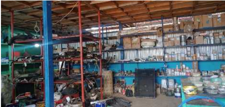
Gambar 1.4 Gudang Logistik