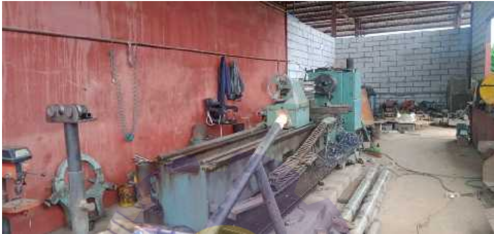
Gambar 1.6 Bengkel Bubut

Bengkel bubut ini dipakai untuk keperluan barang yang akan dibubut seperti, as propeller kapal, as kemudi kapal dan pembuatan as propeller serta kemudi yang baru. Adapun bengkel bubut seperti yang ditunjukkan pada Gambar 1.6.