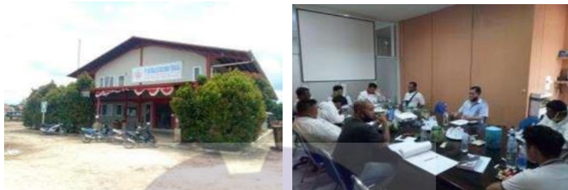
Gambar 1.3 Bagian depan office dan ruangan meeting