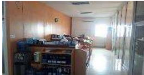
Gambar 1.8 Ruang Komersil