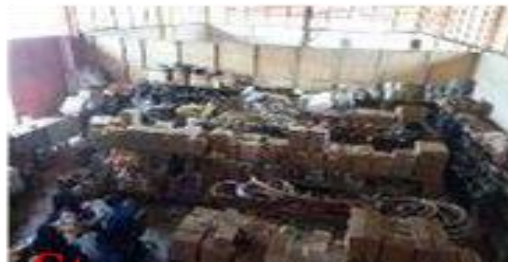
Gambar 1.10 Store/ Gudang