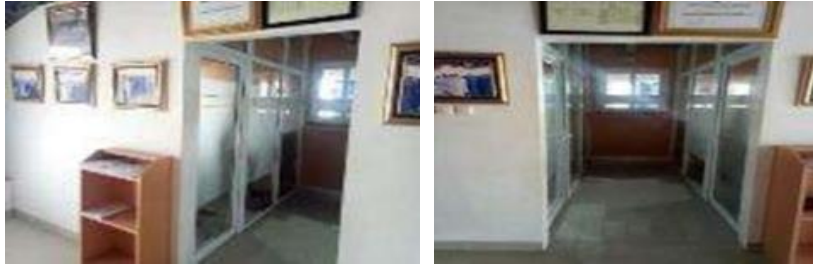
Gambar 1.5 Ruang BKI dan ruang keuangan