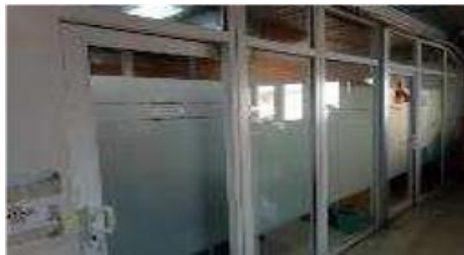
Gambar 1.7 Ruangan Yard Manager