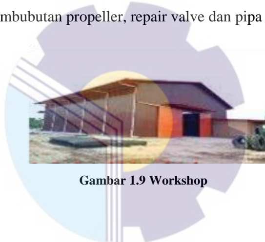
Gambar 1.9 Workshop