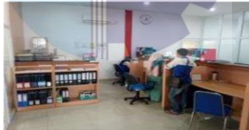
Gambar 1.4 Ruangan adminitrasi