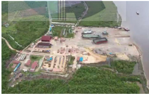
Gambar 1.1 PT. Bengkalis Dockindo Perkasa

PT. Bengkalis Dockindo Perkasa merupakan perusahaan industri galangan kapal yang bergerak dibidang usaha maritim yang kegiatannya membangun kapal baru, pemeliharaan kapal dan perbaikan kapal. PT.Bengkalis Dockindo Perkasa berlokasi di Jln Jln. Kotorejo, Desa Sei Siput - Kec.Siak Kecil Kab. Bengkalis – Riau.Perusahaan ini memiliki luas areal 90.000 M 2 Lapangan untuk Dry Dock untuk melayani perbaikan dan pembangunan kapal baru dengan kapasitas 10.000 Ton / 8.000 Grt. Bangunan kantor Mess Karyawan/ Staff WorkShop.Sarana Ibadah, Storage Material, fabrikasi dan erection new building area seperti pada gambar 1.1 di bawah ini.