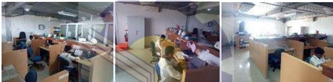
Gambar 1.6 Ruangan staff kerja karyawan