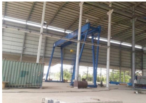
Gambar 1. 3 Main workshop fabrication