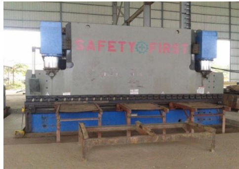
Gambar 1. 4 Mesin Bending