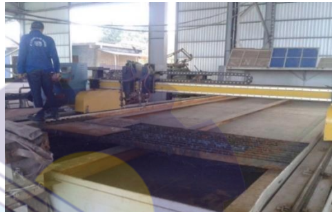
Gambar 1. 5 Mesin Computer Numerical Control (CNC)