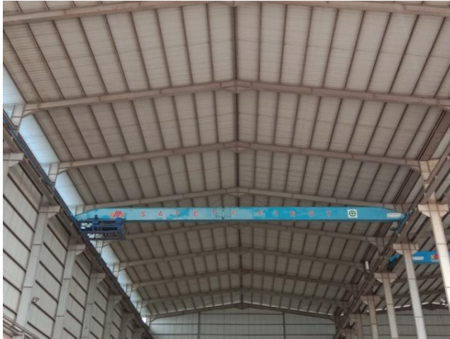
Gambar 1. 7 Overhead Crane