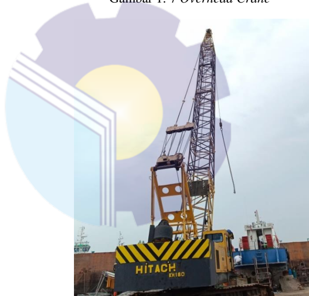
Gambar 1. 8 Crawler Crane