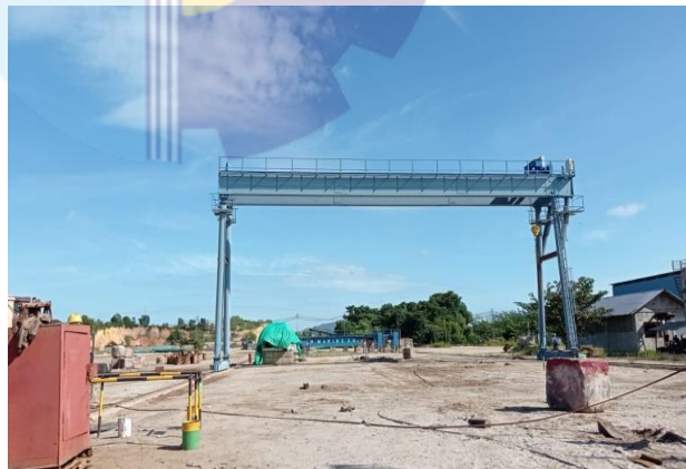
Gambar 1. 6 Gantry Crane