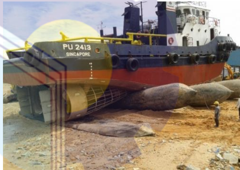
Gambar 1. 2 Slip Way

Merupakan sarana penunjang operasional harian, Fungsi Tug Boat ini antara lain untuk menarik dan mendorong kapal yang akan repair maupun juga untuk menarik kapal baru setelah di lauching .