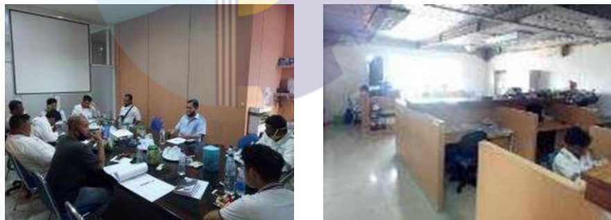
Gambar 2.1 Ruangan PIC

Pada gambar 2.1 menerangkan ruangan PIC, pada ruangan PIC ini memiliki beberapa sarana kerja berupa. Meja kursi printer laptop dan alat kerja lainnya, pada ruangan PIC ini terdapat juga ruangan Yard Meneger dan kasir.