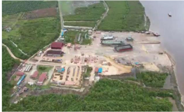
Gambar 1.1 PT. Bengkalis Dockindo Perkasa

Gambar 1.1 ini menggambarkan bentuk denah PT. Bengkalis Dockindo Perkasa Yang berlokasi di Jalan Kotorejo, RT 08 RW 04, Dusun Sukamaju Desa Sei Siput, Kecamatan Siak Kecil, Kabupaten Bengkalis