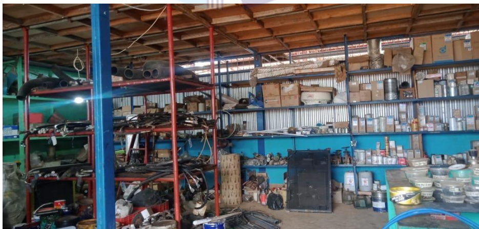
Gambar 1.2 Gudang Logistik

Fasilitas gudang logistik ini digunakan untuk menyimpan berbagai barang persediaan yang dibutuhkan dalam keberlangsungan pekerjaan yang dilakukan diperusahaan seperti, amplas, elektroda , gerinda dan alat-alat lainnya. Adapun gudang logistik seperti yang ditunjukkan pada Gambar 1.2 di bawah ini: