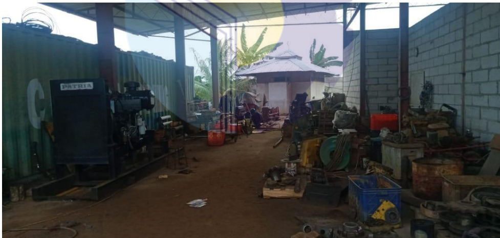
Gambar 1.5 Bengkel Mesin

Bengkel ini digunakan untuk sebagai tempat perbaikan mesin yang rusak mulai dari mesin kapal hingga mesin excavator . Adapun bengkel mesin seperti yang ditunjukkan pada Gambar 1.5 di bawah ini: