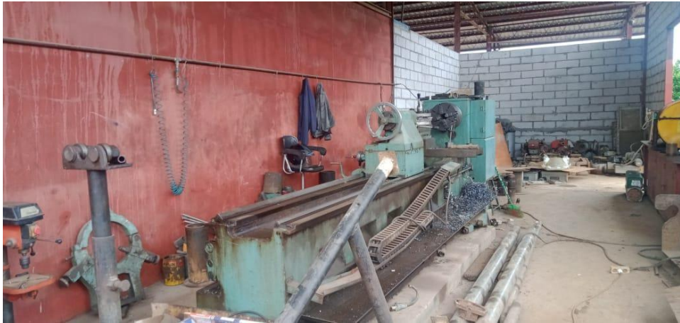
Gambar 1.4 Bengkel Bubut