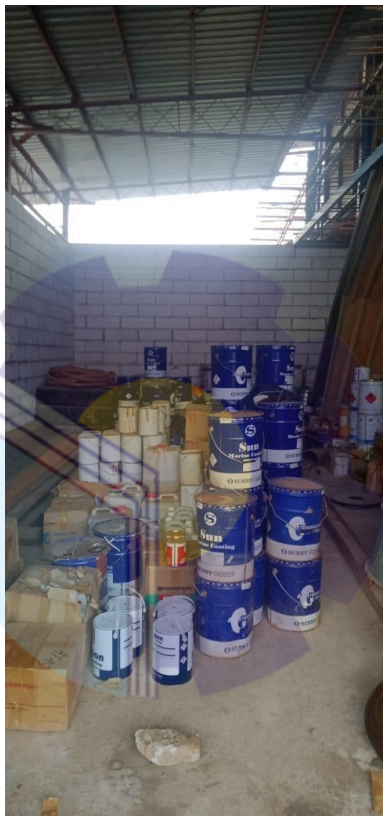
Gambar 1.3 Gudang Penyimpanan Cat

Gudang cat ini digunakan sebagai tempat penyimpanan persediaan berbagai jenis cat, warna cat dan tinner . Tujuan dari penempatan gudang cat ini adalah untuk menyimpan cat dalam jumlah banyak untuk keberlangsungan proses pengecatan diperusahaan. Adapun gudang penyimpanan cat seperti yang ditunjukkan pada Gambar 1.3 di bawah ini: