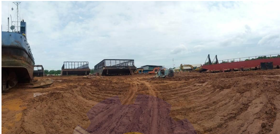
Gambar 1.6 Lahan Galangan

Lahan tanah lapang ini digunakan sebagai area penempatan tongkang dan tug boat yang naik dan akan diperbaiki sesuai kerusakan yang terjadi. Adapun lahan galangan seperti yang ditunjukkan pada Gambar 1.6 di bawah ini: