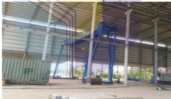
Gambar 1. 2 Main Workshop Fabrication