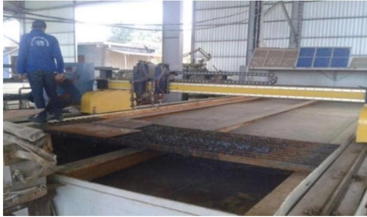
Gambar 1. 4 Mesin CNC