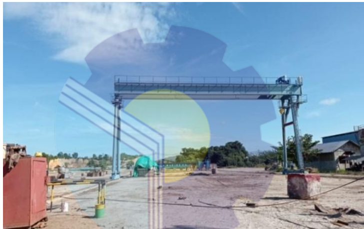
Gambar 1. 5 Gantry Crane