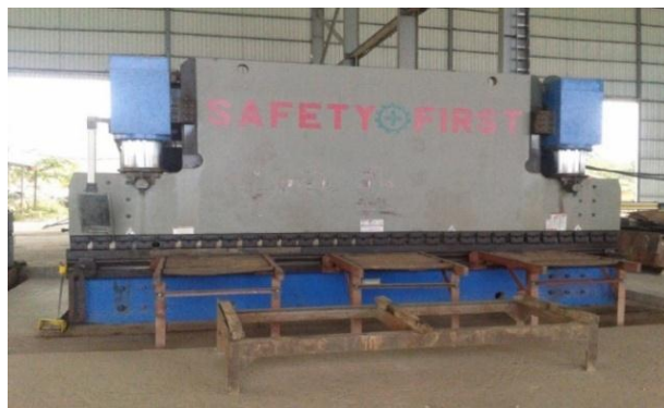
Gambar 1. 3 Mesin Bending