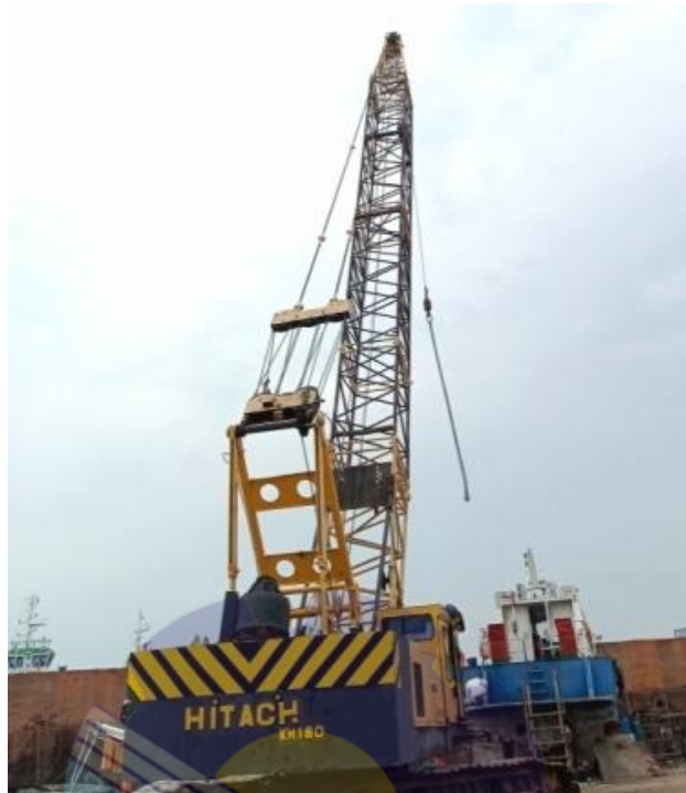
Gambar 1.7 Crawler Crane