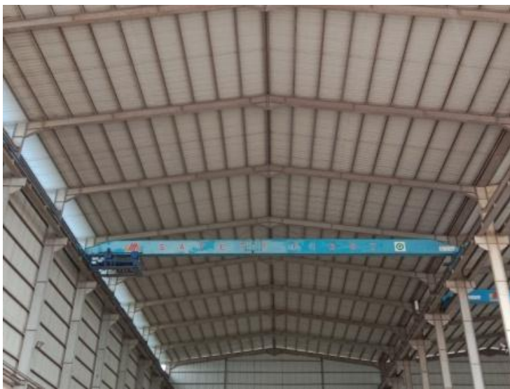
Gambar 1. 6 Overhead Crane