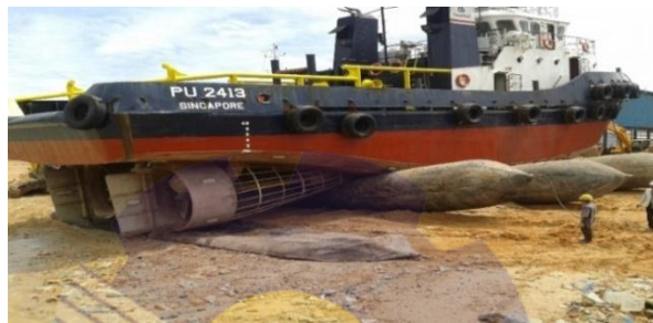
Gambar 1. 1 Slip Way

Adapun gambar Struktur Organisasi bisa dilihat pada Gambar 1. 8