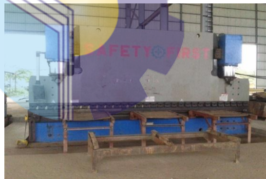
Gambar 1.4 Mesin Bending