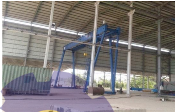
Gambar 1.3 Main Workshop Fabrication

Main Workshop Fabrication merupakan tempat proses fabrikasi dan konstruksi yang dilakukan didalam sebuah bangunan yang di dalamnya sudah tersedia berbagai macam alat dan mesin-mesin untuk melakukan proses potong plat mesin bending , overhead crane dan lainnya. Untuk lebih jelas dapat dilihat pada Gambar 1.3, Gambar 1.4 dan Gambar 1.5.