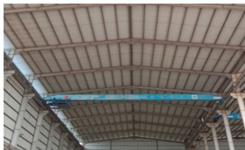
Gambar 1.7 Overhead Crane

Overhead Crane merupakan hoist crane yang terpasang di bagian atas atap bangunan untuk mengangkat dan memindahkan beban. Untuk lebih jelas dapat dilihat pada Gambar 1.7.