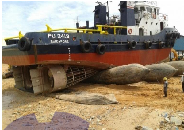
Gambar 1.2 Slip Way

Fasilitas slip way yang di gunakan di sini adalah ballon , dimana ballon ini di gunakan untuk proses penaikan dan penurunan kapal dan untuk spesifikasi ballon untuk materialnya natural rubber dengan diameter 0.6-2.8 m dan panjang 5-24 m. Untuk lebih jelas dapat dilihat pada Gambar 1.2.