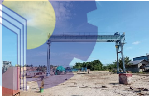
Gambar 1.6 Gantry Crane

Gantry Crane merupakan hoist crane yang memiliki tempat kaki beroda dan bergerak diatas rel yang digunakan untuk mengangkat beban. Untuk lebih jelas dapat dilihat pada Gambar 1.6.