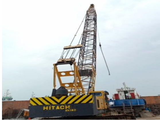
Gambar 1.8 Crawler Crane

Crawler Crane merupakan alat angkat yang dapat berpindah dan memiliki keunggulan bekerja di permukaan yang lunak. Untuk lebih jelas dapat dilihat pada Gambar 1.8.