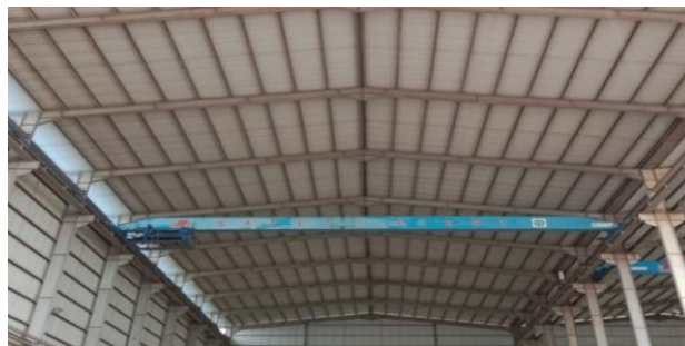
Gambar 1.7 Overhead Crane

Overhead Crane merupakan hoist crane yang terpasang di bagian atas atap bangunan untuk mengangkat dan memindahkan beban. Untuk lebih jelas dapat dilihat pada Gambar 1.7.