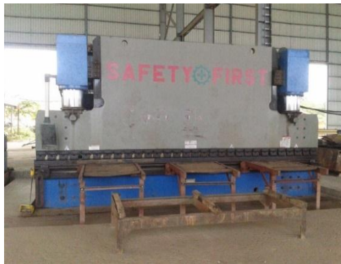
Gambar 1.4 Mesin Bending