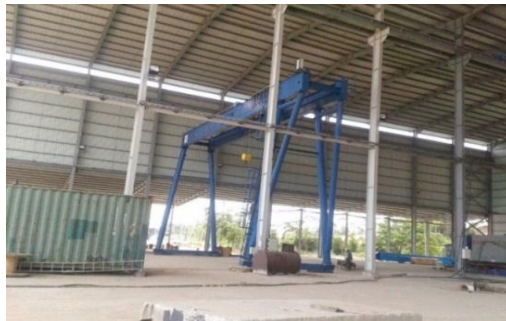
Gambar 1.3 Main Workshop Fabrication

Main Workshop Fabrication merupakan tempat proses fabrikasi dan kontruksi yang dilakukan didalam sebuah bangunan yanag di dalamnya sudah tersedia berbagai macam alat dan mesin-mesin untuk melakukan proses potong plat mesin bending , overhead crane dan lainnya.Untuk lebih jelas dapat dilihat pada Gambar 1.3, Gambar 1.4 dan Gambar 1.5.