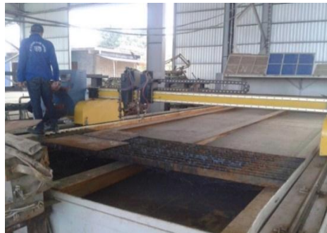
Gambar 1.5 Mesin Computer Numerical Control ( CNC )