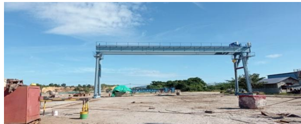
Gambar 1.6 Gantry Crane

Gantry Crane merupakan hoist crane yang memiliki tempat kaki beroda dan bergerak diatas rel yang digunakan untuk mengangkat beban. Untuk lebih jelas dapat dilihat pada Gambar 1.6.