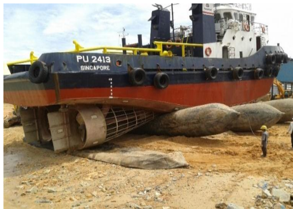
Gambar 1.2 Slip Way

Fasilitas slip way yang di gunakan di sini adalah ballon , dimana ballon ini di gunakan untuk proses penaikan dan penurunan kapal dan untuk spesifikasi ballon untuk materialnya natural rubber dengan diameter 0.6-2.8 m dan panjang 5-24 m. Untuk lebih jelas dapat dilihat pada Gambar 1.2.