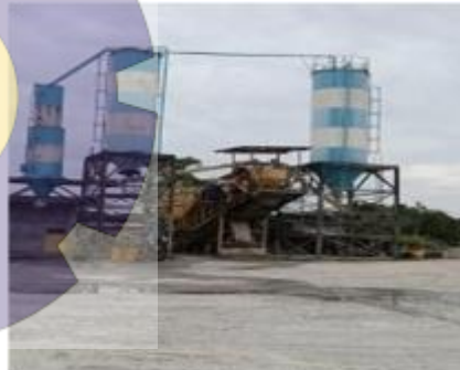
Gambar 1.3. Mesin Batching Plant

Lingkungan di perusahaan selalu menggunakan safety K3, dan dalam kondisi pandemi seperti sekarang ini protokol kesehatan dijalankan dengan sebaiknya, karena diwajibkan menggunakan masker di lingkungan perusahaan dan setiap pagi di cek temperatur suhu saat memasuki perusahaan.