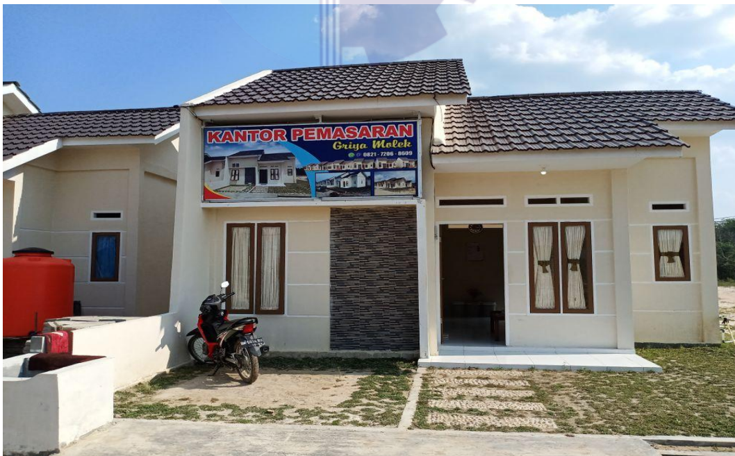
Gambar 1.2 Lokasi PT. Jaya Tulus Prima