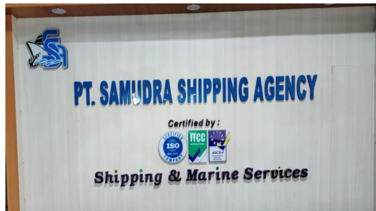
Gambar 1.1 Profil Perusahaan