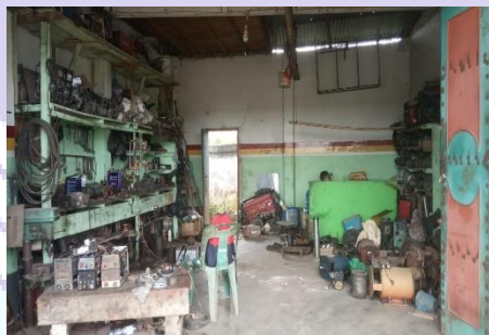
Gambar 1.2 Gambaran Umum CV. An Dinamo

Gambar 1.2 merupakan ruang lingkup dari CV. An Dinamo yang berada di Kota Dumai.