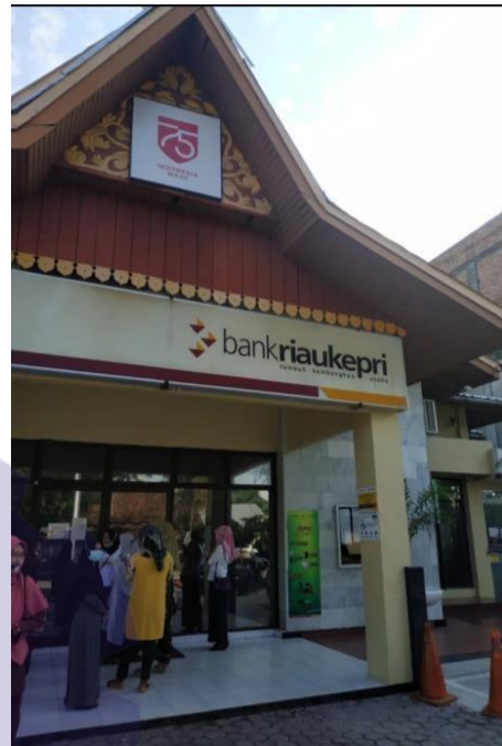
Gambar 1.2 PT. Bank Riau Kepri Tampak Depan