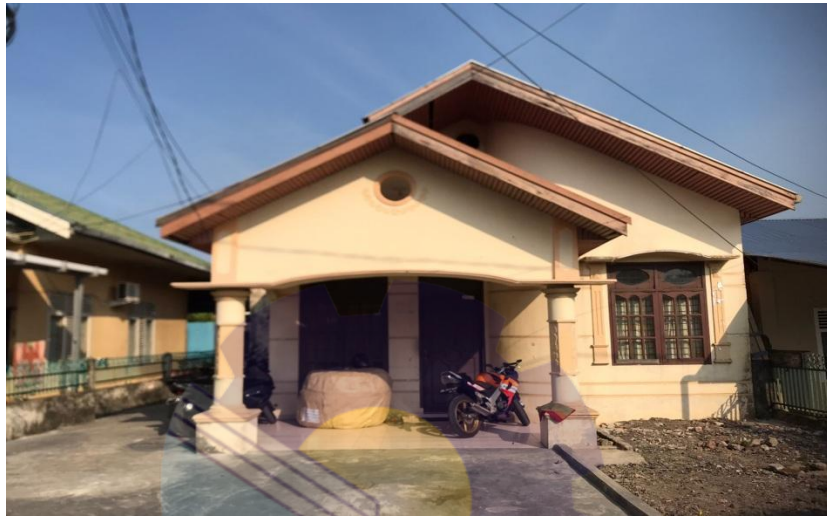
Gambar 1.1 perusahaan

Sejarah dan latar belakang berdirinya suatu perusahaan satu dengan perusahaan yang lain pastilah berbeda-beda. Apabila seorang atau sekelompok orang ingin mendirikan perusahaan ada suatu hal yang harus diputuskan yaitu dalam bidang dan kegiatan operasional tentang penanganan kedatangan dan keberangkatan kapal, kegiatan operasional terkait dalam perusahaan untuk menunjang kegiatan perusahaan pelayanan kapal dimulai dari kedatangan kapal hingga keberangkatan kapal.