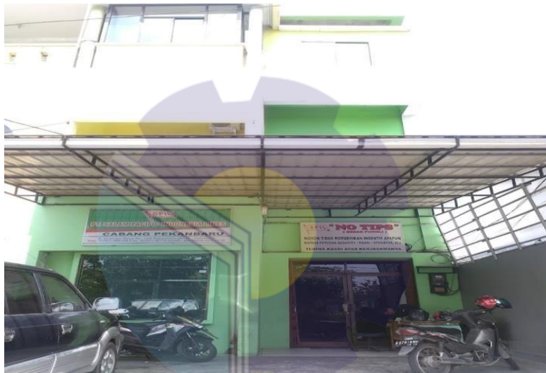
Gambar 1.1 gambar perusahaan

Adapun layanan keagenan PT.Salam Pacific Indonesia Lines (SPIL) ialah sebagai berikut :