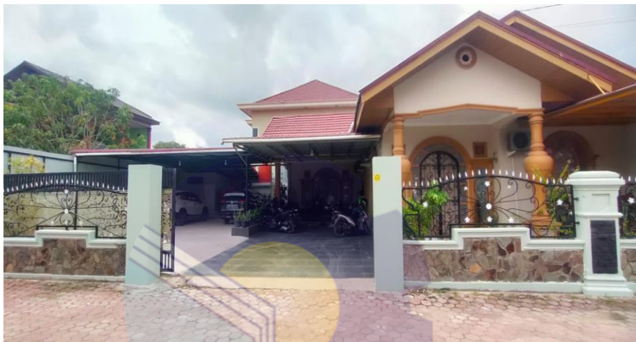
Gambar 1.1 :PT Uban Shipping Agency

Sejarah singkat Perusahaan pelayaran PT urban Shipping Agency sebagai perusahaan. Struktur organisasi dan uraian tugas bidang usaha dalam perusahaan pelayaran, perkembangan kegiatan operasional perusahaan dan mencoba menguraikan tentang penanganan kedatangan kapal dan pemuatan Palm Oil Product (POP) ke kapal hingga kapal keluar dari pelabuhan Dumai.