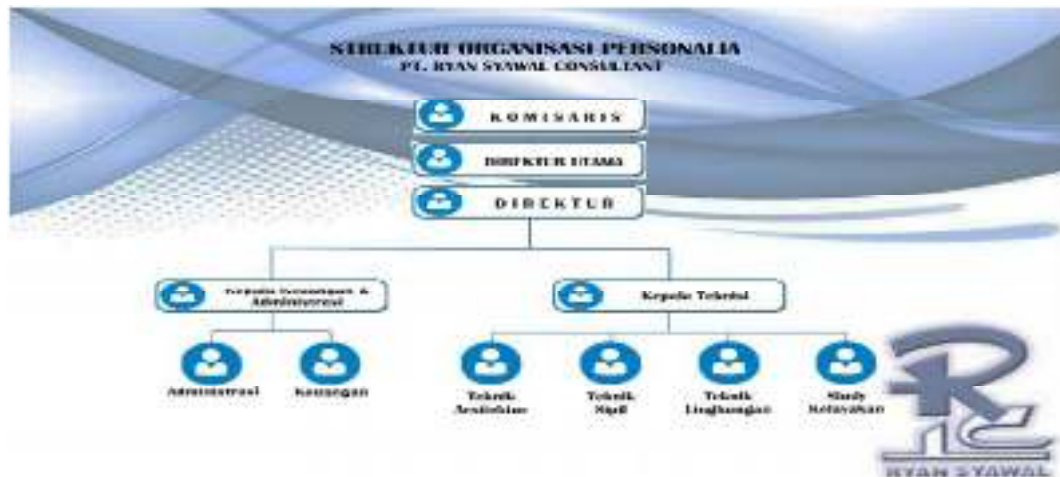
Gambar 1.2 Struktur organisasi perusahaan

Adapun Struktur Organisasi dari PT. RYAN SYAWAL CONSULTAN adalah sebagai berikut :