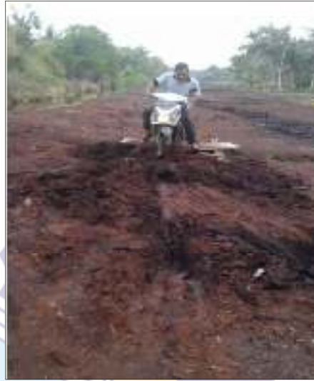
Gambar 1.1 Gambar Jalan Parit Tugu Sebelum Peningkatan

lalu jalan tersebut belum diaspal. Pada tahun 2020 dilakukan perencanaan peningkatan jalan yang awalnya tanah menjadi peningkatan jalan aspal. Peningkatan jalan ini bertujuan agar masyarakat lebih mudah untuk melaksanakan aktifitas sehari-hari.