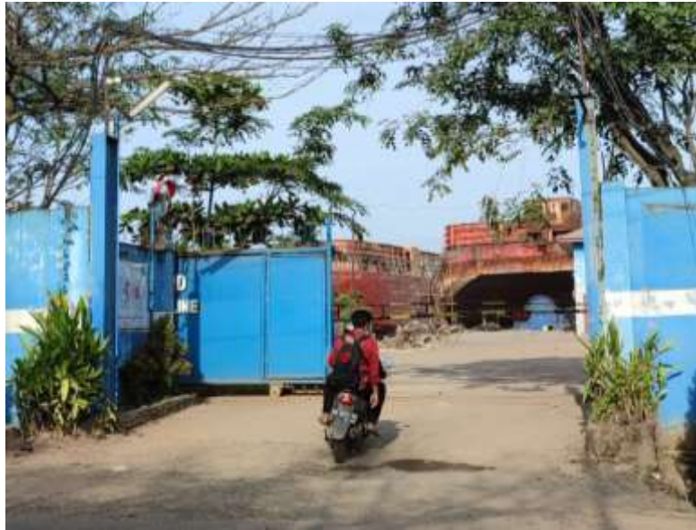
Gambar 1.3. Gerbang masuk PT. DML