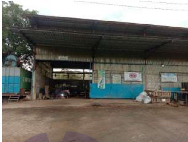
Gambar 1.7 Bengkel

sekaligus untuk tempat memperbaiki alat alat / bagian kapal akan di repair . Untuk lebih jelasnya fasilitas bengkel yang berada di PT Dutabahari Menara Line, dapat kita lihat pada Gambar 1.7.