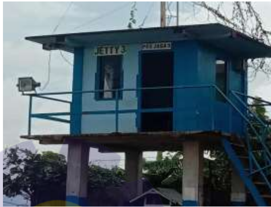
Gambar 1.5 Pos pantau / Jetty