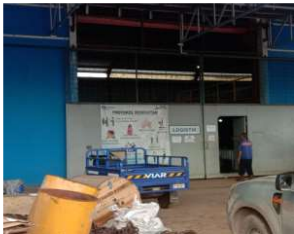
Gambar 1.8 Gudang / Logistik

Gudang tempat penyimpanan peralatan kerja serta material yang digunakan dalam proses pembangunan maupun perbaikan kapal. Untuk lebih jelasnya fasilitas gudang yang berada di PT Dutabahari Menara Line, dapat kita lihat pada Gambar 1.7.