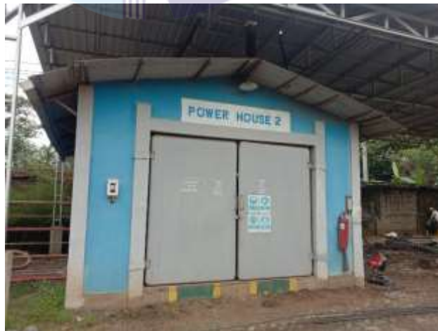
Gambar 1.6 Power House

Power house untuk penyaluran kebutuhan listrik proses produksi di lapangan. Untuk lebih jelasnya fasilitas gardu listrik yang berada di PT Dutabahari Menara Line, dapat kita lihat pada Gambar 1.6.