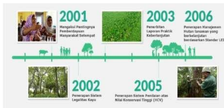
Gambar 1.2 Perkembangan PT. Riau Andalan Pulp and Paper Tahun 2001 - 2005

Pada tahun 2010, kegiatan operasional kehutanan APRIL memberikan kontribusi sebesar 6,9 persen pada total perekonomian Provinsi Riau. APRIL telah menciptakan sekitar 90.000 lapangan kerja bagi masyarakat. APRIL juga berkontribusi terhadap pemberian akses yang lebih baik pada pendidikan dan dukungan sosial di berbagai bidang seperti perawatan kesehatan dan perumahan. APRIL telah membantu meningkatkan standar hidup dan menurunkan tingkat kemiskinan sebesar 30 persen.