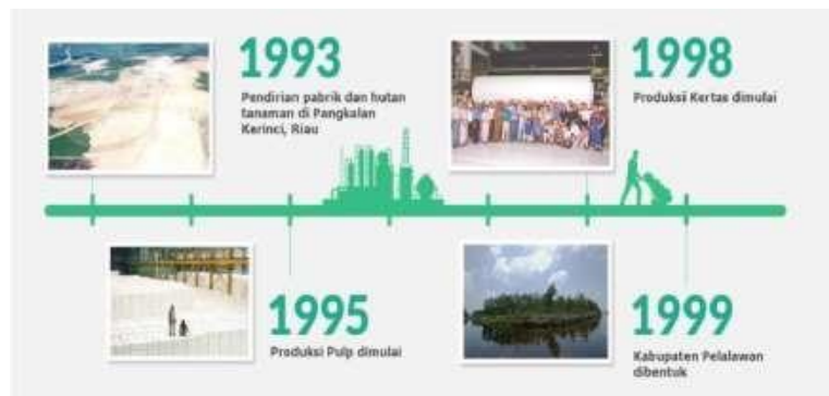
Gambar 1.1 Perkembangan PT. Riau Andalan Pulp and Paper Tahun 1993 – 1999

Sebagai salah satu pelopor perusahaan yang bertanggung jawab, APRIL dan anak perusahaannya melaksanakan prinsip 5C yang dipercaya oleh Bapak Sukanto Tanoto. Praktek bisnis harus membawa kebaikan bagi Masyarakat ( Community ), Negara ( Country ), Iklim ( Climate ), Pelanggan ( Customer ) dan pada akhirnya baik bagi Perusahaan ( Company ). Dengan demikian, tanggung jawab sosial perusahaan diaplikasikan dalam operasional dan manajemen APRIL untuk memajukan lingkungan dan mengembangkan masyarakat serta untuk memenuhi tanggung jawab sosial korporasi. Tanoto Foundation yang didirikan pada tahun 1981 merupakan penerapan visi ini.