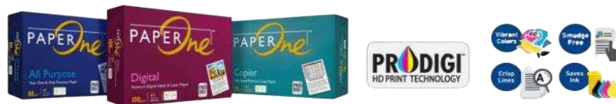
Gambar 1.5 Produk PT. Riau Andalan Pulp and Paper

PT. Riau Andalan kertas atau yang lebih dikenal dengan Riau Paper merupakan pabrik pembuatan kertas, yang memproduksi kertas photocopy dan uncoated wood free bergramatur 50 gsm sampai 120 gsm dengan menggunakan dua unit mesin kertas berteknologi terkini dan berkecepatan tinggi. Kertas yang dihasilkan oleh Riau paper dipasarkan dalam bentuk Cut Size , Folio Sheeter maupun gulungan ( Roll ), dengan merek dagang yang telah dikeluarkan seperti Paper One , Copy Paper dan Dunia Mas .