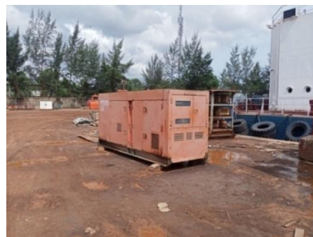
Gambar 1.8 Listrik PLN