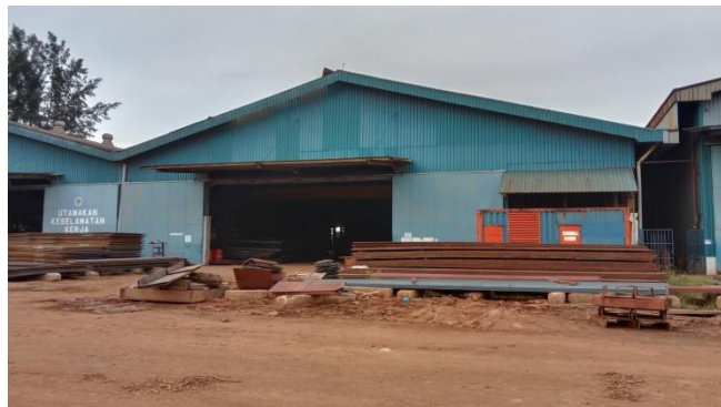
Gambar 1.15 Bengkel Bending

Bengkel yang dapat digunakan untuk menekuk material seperti plat dan pipa yang diperlukan dalam sebuah bangunan baru kapal serta item-item yang melengkung yang dibutuhkan, dapat kita lihat pada gambar 1.15.