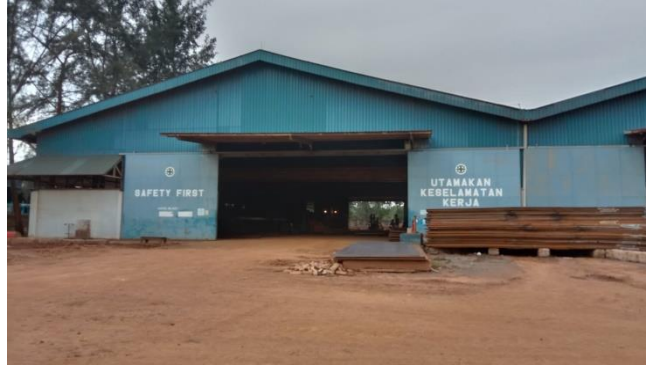
Gambar 1.14 Bengkel Auto Blast

pelapis pada bahan yang diperlukan sebuah bangunan baru kapal, dapat kita lihat pada gambar 1.14