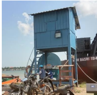
Gambar 1.5 Pos Pantau