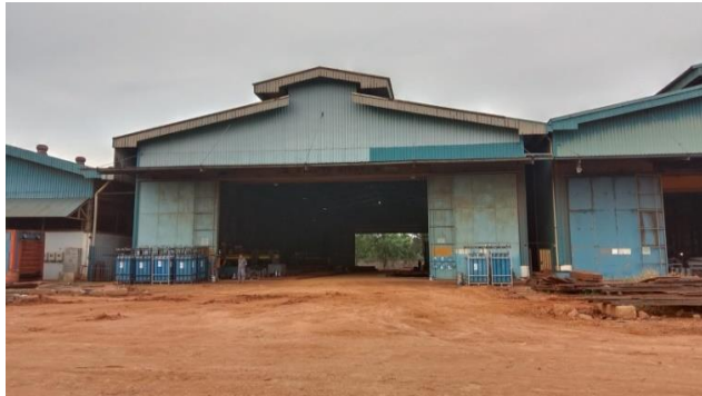
Gambar 1.16 Bengkel CNC