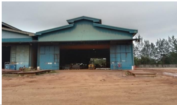
Gambar 1.17 Bengkel Bubut

Bengkel ini menggunakan mesin utama mesin bubut untuk keperluan pembubutan pada shaft propeller tugboat dan kepentingan lainnya yang mengandalkan mesin bubut, dapat kita lihat pada gambar 1.17