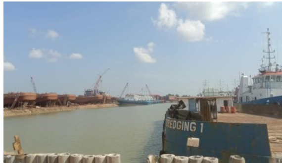
Gambar 1.9 Jetty

Dermaga yang terdapat di PT. Karya Teknik Utama ini adalah tambat. Untuk lebih jelasnya fasilitas dermaga atau jetty yang berada di PT. Karya Teknik Utama dapat kita lihat pada Gambar 1.9