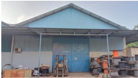
Gambar 1.12 Store II