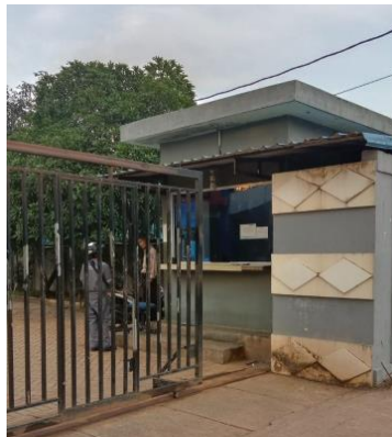
Gambar 1.4 Pos Utama

Terminal khusus ( Tersus ) PT. Karya Tehknik Utama saat ini mempunyai 2 buah pos security, yaitu: Pos utama dan Pos 2, terletak di Pintu gerbang dan berada disisi bagian depan main office dan sebelah timur dari pos utama merupakan salah satu akses masuk ke fasilitas pelabuhan dari darat. Untuk lebih jelasnya aktifitas pos utama yang berada di PT. Karya Teknik Utama yang berada di PT. Karya Teknik Utama, dapat kita lihat pada gambar 1.4