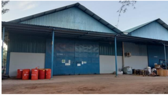
Gambar 1.11 Store I