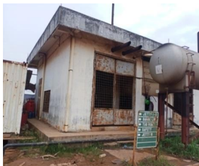
Gambar 1.7 Generator Set

Selain itu adalagi fasilitas untuk listrik dari PLN dan generator set . Fasilitas ini digunakan untuk penerangan diarea PT. Karya Teknik Utama. Untuk lebih jelas fasilitas PLN yang berada di PT. Karya Teknik Utama dapat kita lihat pada Gambar 1.7 dan Gambar 1.8.