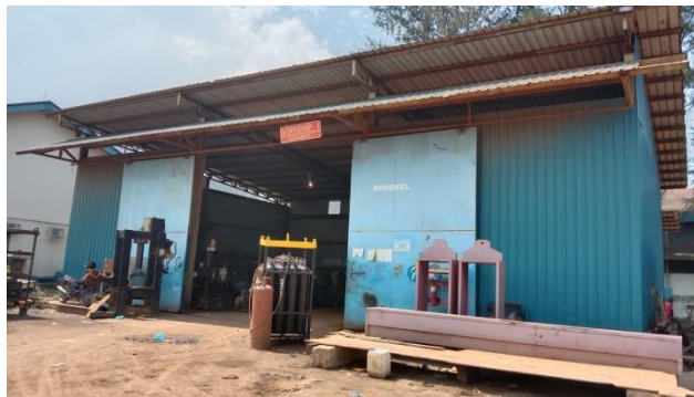
Gambar 1.10 Work shop (Mechanic)

Workshop tempat untuk melakukan perbaikan pada mesin kendaraan berat yang rusak atau mau dilakukan service pada mesin kendaraan yang digunakan dalam proses distribusi dan fabrikasi kapal baik untuk bangunan baru maupun perbaikan. Berikut workshop yang berada di PT.Karya Teknik Utama.