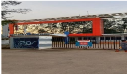
Gambar 1. 3 Pintu Gerbang Utama