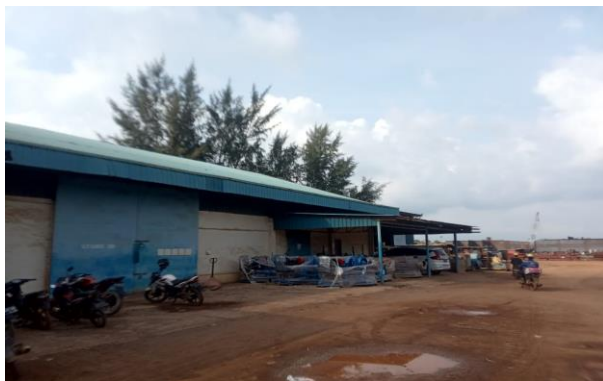
Gambar 1.13 Store III

Store III adalah tempat untuk menyimpan barang peralatan kapal seperti tali tambat, propeller kapal dan lainnya yang berhubungan dengan perlatan dalam sebuah kapal, dapat kita lihat pada Gambar 1.13.