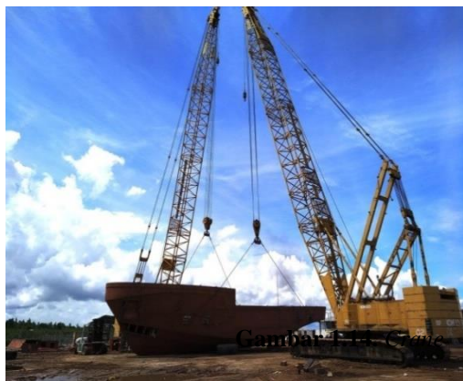
Gambar 1.15. Crane