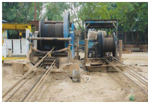
Gambar 1.13 winch