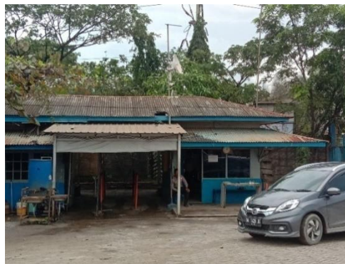
Gambar 1.5. Pos Keamanan

PT Dutabahari Menara Line Dockyard saat ini mempunyai 2 pos security, yaitu Pos utama, terletak di Pintu gerbang dan berada disisi bagian depan fasilitas galangan yang merupakan satu-satunya akses masuk dari darat. Untuk lebih jelasnya aktifitas pos utama yang berada di PT. Dutabahari Menara Line Dockyard , dapat kita lihat pada Gambar 1.5