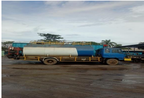
Gambar 1.14. Truck Tanki Oil