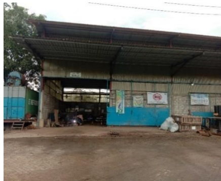
Gambar 1.6. Bengkel

Bengkel tempat untuk melakukan perbaikan shaft dan pembubutan shaft yang akan digunakan dalam proses repair dan sekaligus untuk tempat memperbaiki alat / bagian kapal akan di repair . Untuk lebih jelasnya fasilitas bengkel yang berada di PT Dutabahari Menara Line Dockyard, dapat kita lihat pada Gambar 1.6