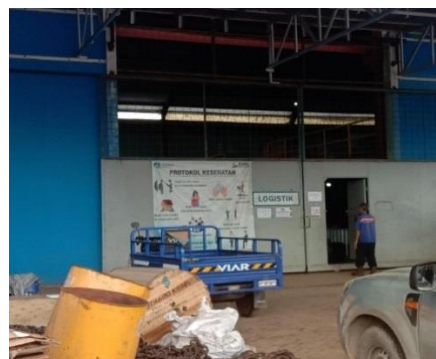
Gambar 1.7. gudang / Logistic

Gudang tempat penyimpanan peralatan kerja serta material yang digunakan dalam proses pembangunan maupun perbaikan kapal. Untuk lebih jelasnya fasilitas gudang yang berada di PT Dutabahari Menara Line Dockyard, dapat kita lihat pada Gambar 1.7.