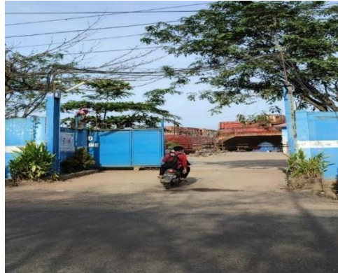
Gambar 1.4. Pintu Masuk