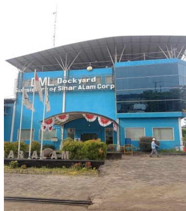
Gambar I.3. Main Office

Merupakan kantor utama general manager , tempat kantor yang mengurus karyawan dan sumber daya manusia, dikantor tersebut juga terdapat ruang rapat dan kantor staf karyawan divisi produksi bangunan baru.