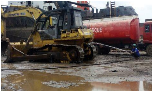
Gambar 1.12. Dozer