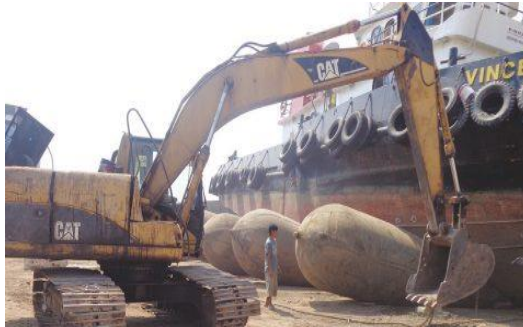
Gambar 1.9. Excavator