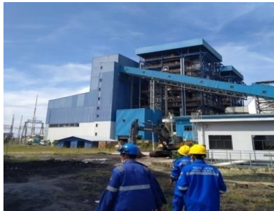
Gambar 1.1. Penampakan Salah Satu Bagian PT PJB UBJOM PLTU Tenayan

Pembangunan PLTU Riau (2 x 110 MW) - Tenayan ini guna memenuhi pasokan tenaga listrik yang akan mengalami deficit sampai beberapa tahun mendatang, serta menunjang program diverifikasi energi untuk pembangkit listrik dari bahan bakar minyak (BBM) ke non BBM dengan memanfaatkan batu bara berkalori rendah. Bahan bakar PLTU Riau (2 x 110 MW)-Tenayan menggunakan batu bara berkalori rendah 3,800 - 4.700 kkal yang dipasok dari tambang batu bara di Sumatera Selatan dan Jambi.