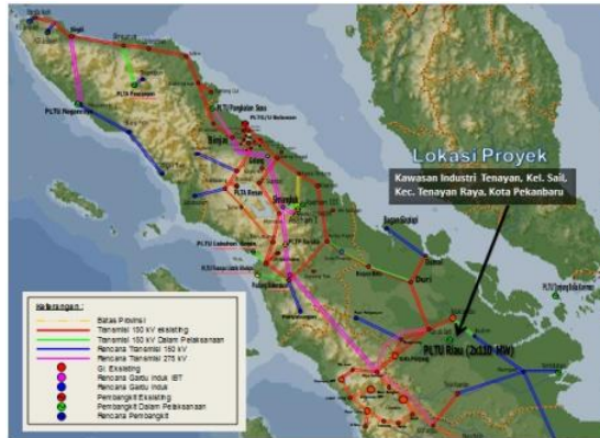
Gambar 1.7. Lokasi PT PJB UBJOM PLTU Tenayan

Lokasi Proyek : Kify Kat Sall Kec. Senay Rays Kota PrasWERING