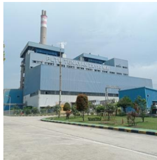
Gambar 1.1. Penampakan PT PJB UBJOM PLTU Tenayan

Perkembangan proyek percepatan pembangkit tenaga listrik berbahan bakar batubara berdasarkan pada Peraturan Presiden RI (PerPres) Nomor 59 Tahun 2009 tanggal 23 Desember 2009 tentang penugasan kepada PT PLN (Persero) untuk melakukan pembanguna proyek 10.000 MW yang tersebar diseluruh Indonesia dimana salah satunya berlokasi di Pekanbaru. PLTU Riau (2 x 110 MW) - Tenayan resmi beroperasi sejak 1 Januari 2017, serta akan menambah daya untuk jaringan transmisi di Riau yang saat ini tingkat elektrisasinya baru 75,51%.