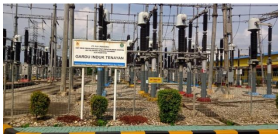
Gambar 1. 2. Gardu Induk PT PJB UBJOM PLTU Tenayan

Provinsi Riau termasuk salah satu daerah krisis pasokan listrik, sehingga PT PLN (Persero) selaku pemegang kuasa ketenagalistrikan berkewajiban segera mengatasi krisis energy listrik tersebut. Salah satu usaha yang dilakukannya adalah pembangunan PLTU Riau (2 x 110 MW) yang terletak dikelurahan Sail kecamatan Tenayan Raya Kota Pekanbaru Provinsi Riau.