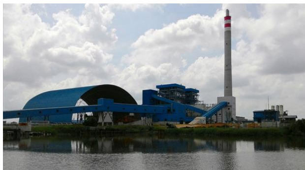
Gambar 1.2. PT PJB UBJOM PLTU Tenayan Dari Belakang

Dibangun di atas lahan seluas 40 hektar, PLTU Tenayan ini berada persis di tepi Sungai Siak untuk memudahkan pengangkutan suplai batu bara yang kebutuhannya sebesar satu juta ton per tahun, atau setara dengan 1.824 ton per hari. Meski masih masuk Kota Pekanbaru, PLTU tersebut berada di tengah-tengah kebun sawit warga. Tak jauh dari lokasi pembangkit, terdapat kawasan pusat pemerintahan yang ditandai dengan keberadaan Kantor Wali Kota Pekanbaru yang tengah dibangun.