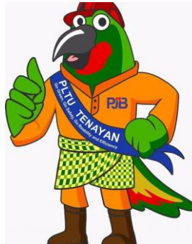
Gambar 1.6. Maskot PT PJB UBJOM PLTU Tenayan

“Si GARES” ( Go Green, Go Safety, Go Reability, Efficiency )