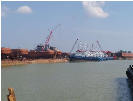
Gambar 1.9 Jetty

Dermaga yang terdapat di PT. Karya Teknik Utama ini adalah tambat. Untuk lebih jelasnya fasilitas dermaga atau jetty yang berada di PT. Karya Teknik Utama dapat kita lihat pada Gambar 1.9