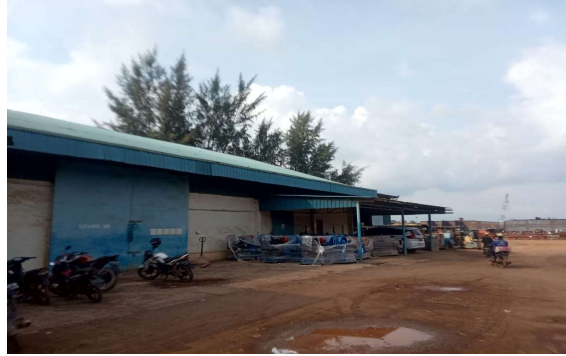
Gambar 1.13 Store III