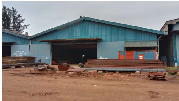
Gambar 1.15 Bengkel Bending