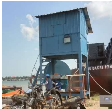
Gambar 1. 4 Pos pantau