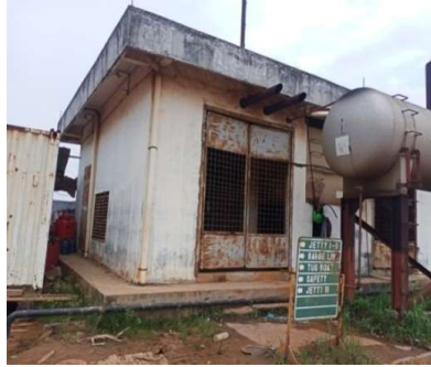
Gambar 1. 5 Generator set