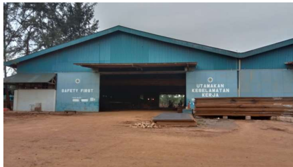
Gambar 1.14 Bengkel Auto Blast

Bengkel auto blast merupakan bengkel yang mempunyai mesin blasting yang metodenya efektif untuk menghilangkan kontamina permukaan, membersihkan dan menghaluskan permukaan yang halus sebelum menerapkan primer atau pelapis pada bahan yang diperlukan sebuah bangunan baru kapal, dapat kita lihat pada gambar 1.14