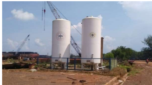
Gambar 1.6 Tangki O 2

Untuk kebutuhan Oksigen terminal khusus (Tersus) PT Karya Teknik Utama menggunakan tangki suplayer O 2 . Untuk lebih jelasnya fasilitas tangki suplayer O 2 yang berada di PT Karya Teknik Utama, dapat dilihat pada gambar 1.6