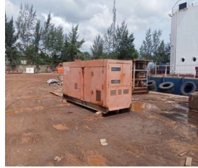
Gambar 1. 6 Listrik PLN