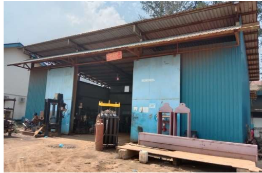
Gambar 1.10 Workshop (Mechanic)