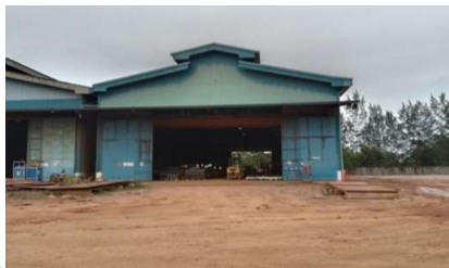
Gambar 1.17 Bengkel Bubut

Bengkel ini menggunakan mesin utama mesin bubut untuk keperluan pembubutan pada shaft propeller tugboat dan kepentingan lainnya yang mengandalkan mesin bubut, dapat kita lihat pada gambar 1.17