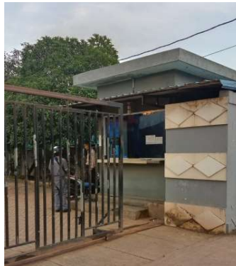
Gambar 1.4 Pos Utama

Terminal khusus ( Tersus ) PT. Karya Teknik Utama saat ini mempunyai 2 buah pos security , yaitu: Pos utama dan Pos 2, terletak di Pintu gerbang dan berada disisi bagian depan main office dan sebelah timur dari pos utama merupakan salah satu akses masuk ke fasilitas pelabuhan dari darat. Untuk lebih jelasnya aktifitas pos utama yang berada di PT. Karya Teknik Utama yang berada di PT. Karya Teknik Utama, dapat kita lihat pada gambar 1.4