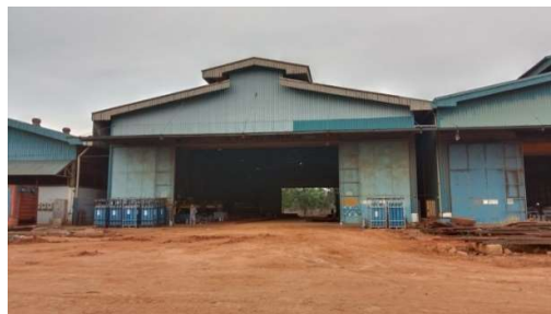
Gambar 1.16 Bengkel CNC

Bengkel CNC ( Computer Numerical Control ), bengkel ini merupakan bengkel yang menggunakan sistem otomasi mesin perkakas yang dioperasikan oleh perintah yang diprogram secara abstrak untuk proses fabrikasi bahan yang diperlukan sebuah kapal tongkang atau Tugboat serta untuk keperluan lainnya, dapat kita lihat pada gambar 1.16.