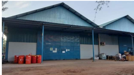
Gambar 1.11 Store I

Store I dan II ini merupakan tempat dimana difungsikan sebagai penyimpanan barang seperti aksesoris untuk kapal, mesin-mesin kapal dan alat kelistrikan kapal. Untuk lebih jelasnya fasilitas gudang-gudang yang berada di PT. Karya Teknik Utama, dapat kita lihat pada Gambar 1.11 dan Gambar 1.12.