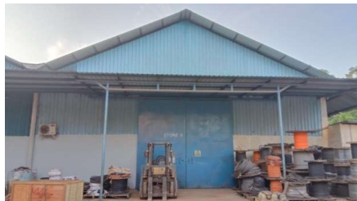
Gambar 1.12 Store II