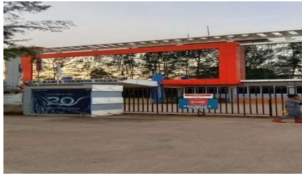
Gambar 1. 3 Pintu Gerbang Utama