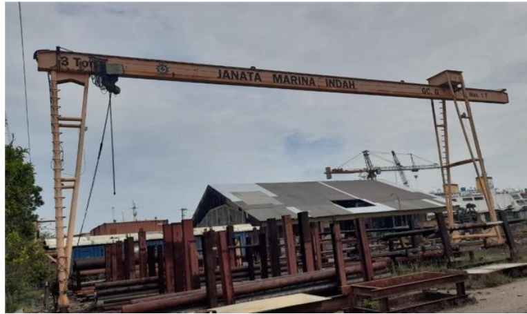
Gambar 1. 12 Gantry Crane