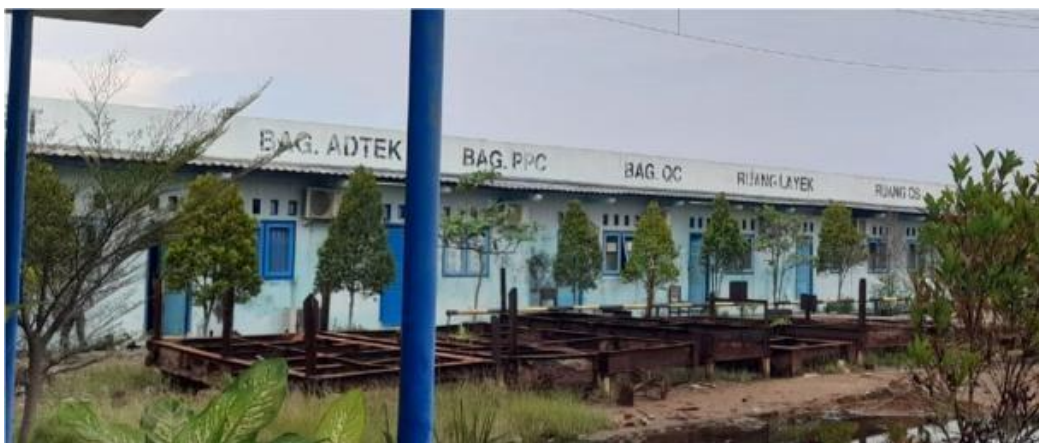
Gambar 1. 5 Kantor Bagian

Mengawasi dan mengatur jalannya aktifitas dan kegiatan perusahaan. Bertanggung jawab penuh terhadap proses kegiatan perusahaan. Memberikan bimbingan dan pengarahan kepada para staf bawahannya. Bertanggung jawab memberikan laporan secara periodik kepada kepala divisi masing-masing divisi. . Jika lebih jelas lihat pada Gambar 1.5.