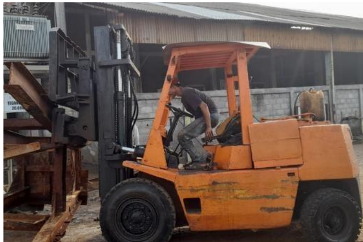
Gambar 1. 15 Forklif

Forklif di JMI ada 5 buah dengan kapasitas 3 ton-5ton, dimana alat forklift ini juga sangat penting untuk memindahkan barang dari suatu tempat ke tempat lain. Jika lebih jelas lihat pada Gambar 1.15.