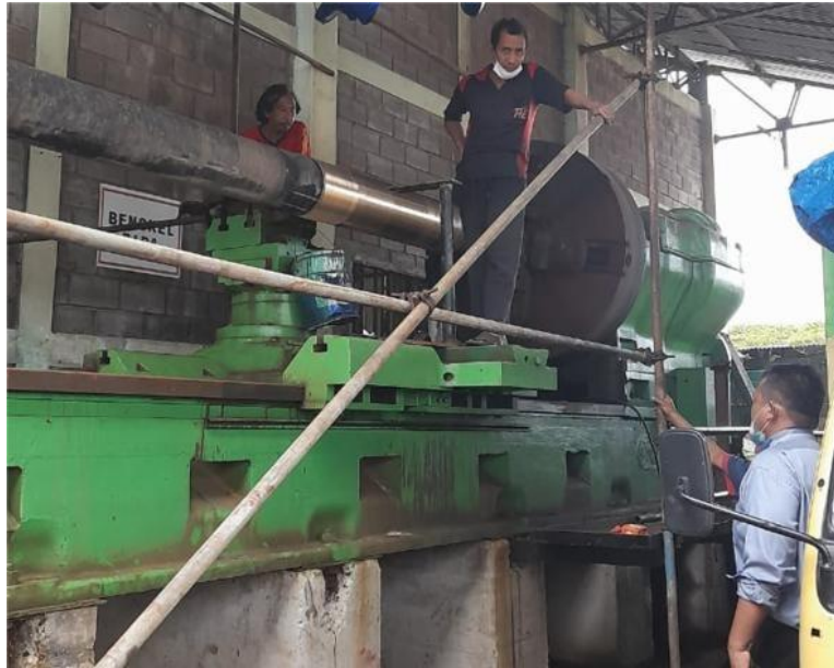
Gambar 1. 18 Bengkel Mesin