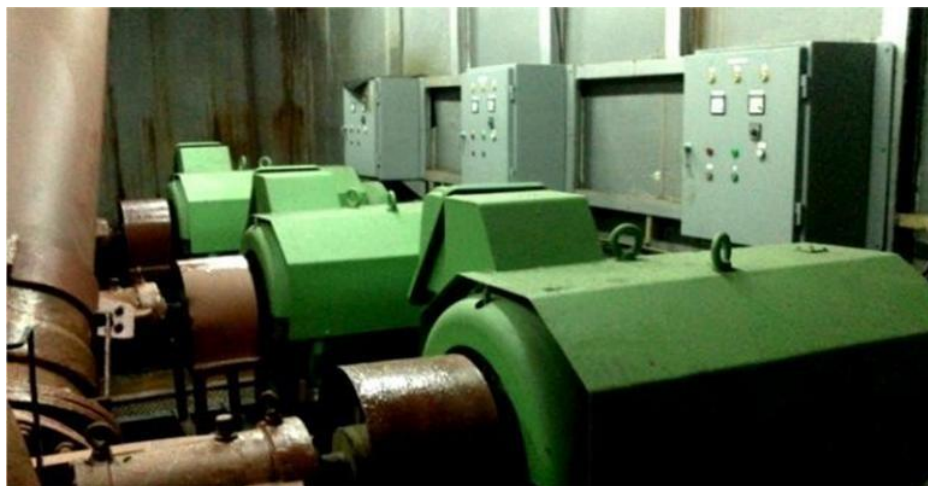
Gambar 1. 10 Motor Pompa Graving Dock

Pompa utama pada graving dock ini berlokasi disekitar pintu ponton. Fungsinya yaitu untuk memasukkan air kedalam graving dock ketika kapal hendak masuk lalu mengeluarkan air dari dalam graving dock sehingga kapal bisa duduk diganjalan ( keel block dan side block ) yang sudah disusun sebelumnya Jika lebih jelas lihat pada Gambar 1.10.