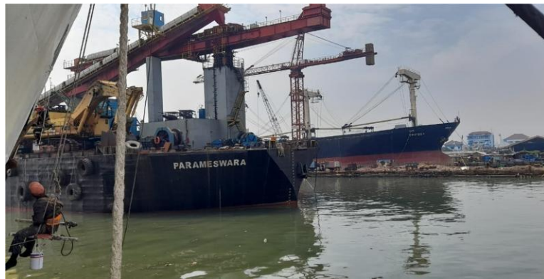
Gambar 1. 9 Floating Quay

Fasilitas ini digunakan untuk pekerjaan perbaikan kapal untuk pekerjaan yang bisa dilakukan diatas air. Pekerjaan ringan untuk bagian atas kapal Jika lebih jelas lihat pada Gambar 1.9.