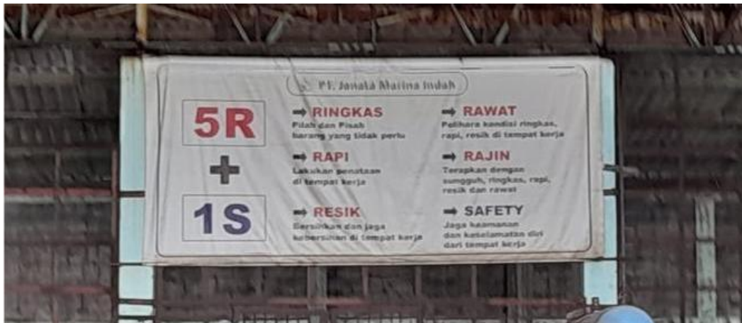
Gambar 1. 4 Budaya Kerja 5R+1S