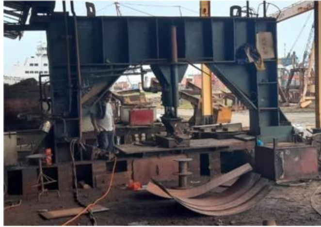
Gambar 1. 14 Mesin Bending