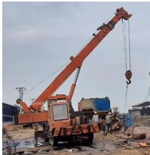
Gambar 1. 13 Mobil Crane

Mobil Crane di PT JMI Unit II ada 4 buah dengan kapasitas 5 ton – 15 ton, crane sangat penting untuk kelancaran pekerjaan. Mobil crane umumnya digunakan untuk mengangkat atau memindahkan barang dari di dock atau dari kapal. Mobil crane juga umumnya digunakan untuk mengangkat benda-benda berat diluar pekerjaan docking Jika lebih jelas lihat pada Gambar 1.13.