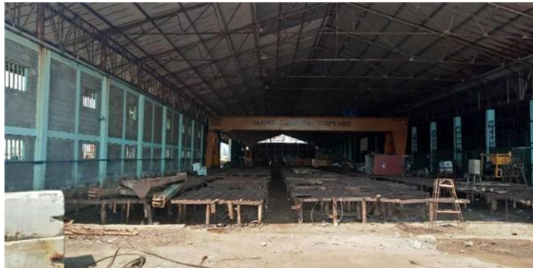
Gambar 1. 17 Bengkel Fabrikasi

Bengkel fabrikasi merupakan tempat untuk proses pembuatan part atau komponen kapal dari dasar sebuah desain part itu sendiri. Jika lebih jelas lihat pada Gambar 1.17.