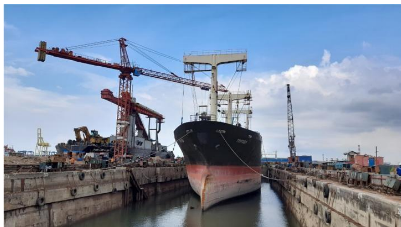
Gambar 1. 8 Graving Dock

Graving dock merupakan salah satu fasilitas utama yang ada di PT. Janata Marina Indah. Sesuai dengan namanya, graving dock sendiri biasa disebut dengan dock kolam yang dilengkapi dengan konstruksi pintu berupa sebuah ponton. Graving dock merupakan salah satu sarana yang amat penting di perusahaan ini dimana dengan sarana tersebut, kapal dapat direparasi secara menyeluruh baik bagian di atas air maupun di bawah air. Graving dock secara fungsional lebih efisien digunakan untuk kegiatan reparasi kapal tetapi tidak menutup kemungkinan juga difungsikan untuk membuat bangunan kapal baru. Ukuran graving dock yang ada di PT. Janata Marina Indah Unit 2 ini yaitu berukuran 150 m (panjang) x 26,8 m (lebar) x 7 m (tinggi) Jika lebih jelas lihat pada Gambar 1.8.