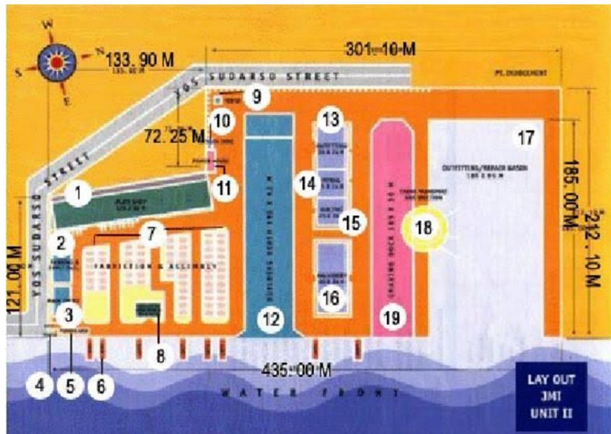
Gambar 1. 3 Lay Out JMI Unit II Versi Warna