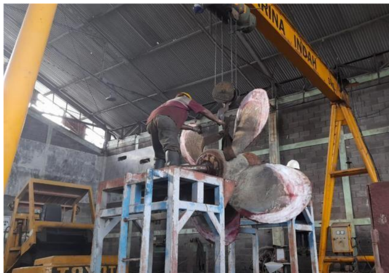
Gambar 1. 19 Bengkel Outfitting

Di bengkel outfitting yang terdapat di PT. Janata Marina Indah terdapat beberapa peralatan pendukung seperti mesin pembengkok pipa, mesin gerinda, alat-alat listrik, las asetelin, mesin bor dan mesin bubut di PT. Janata Marina Indah Jika lebih jelas lihat pada Gambar 1.19 .