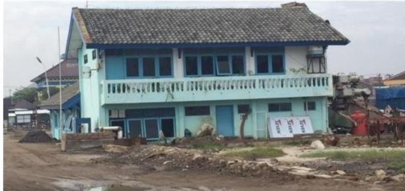
Gambar 1. 7 Kantor Utama JMI