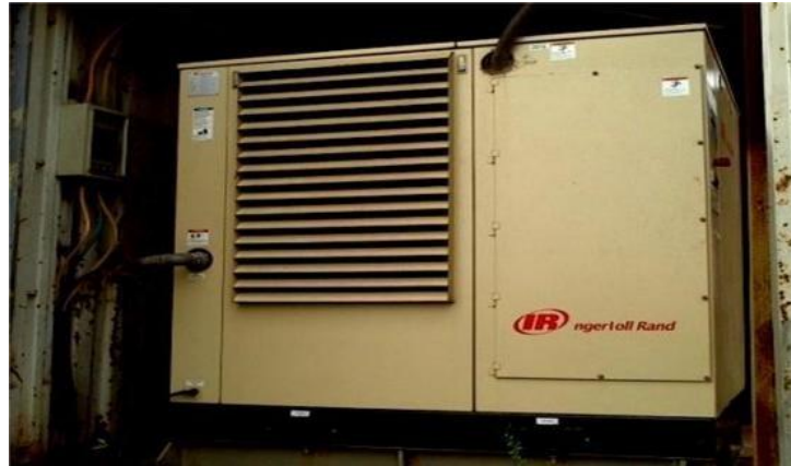
Gambar 1. 16 Electric Air Compressor