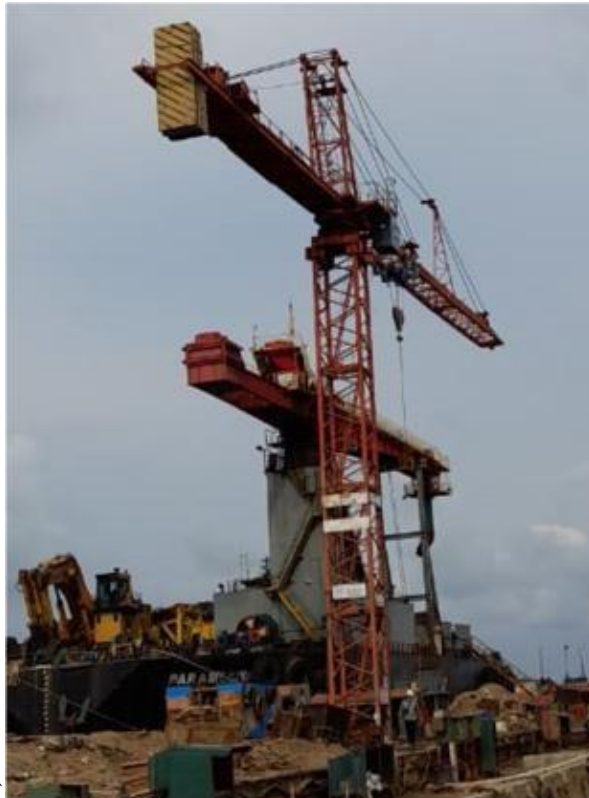
Gambar 1. 11 Tower Crane

Crane berkapasitas SWL 15 Ton terletak disamping graving dock dan floating quay berfungsi untuk mengangkat dan menurunkan muatan material repair yang akan di aplikasikan ketika proses reparasi sedang berlangsung Jika lebih jelas lihat pada Gambar 1.11.