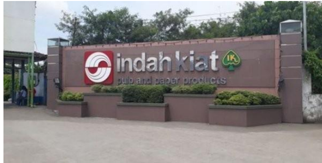
Gambar 1.2 Logo PT. Indah Kiat Pulp & Pulper