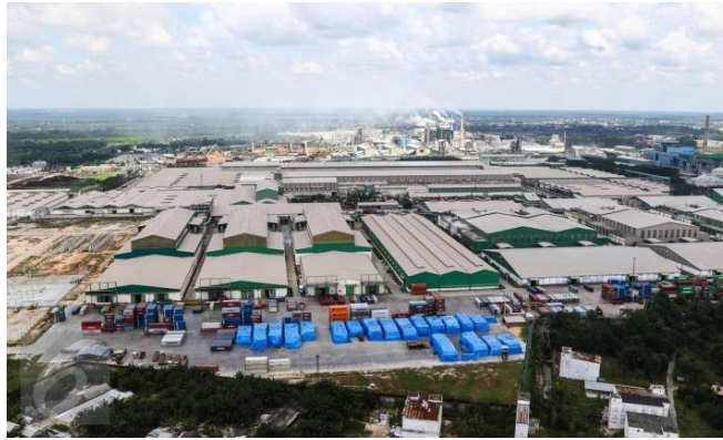
Gambar 1.1 PT Indah Kiat Pulp & Paper Perawang

Sementara itu pengoperasian mesin kertas line 3 di pabrik kertas Tangerang dilakukan disamping persiapan lokasi pabrik Pulp di desa Pinang Kabupaten Siak Sri Indrapura, Provinsi Riau.