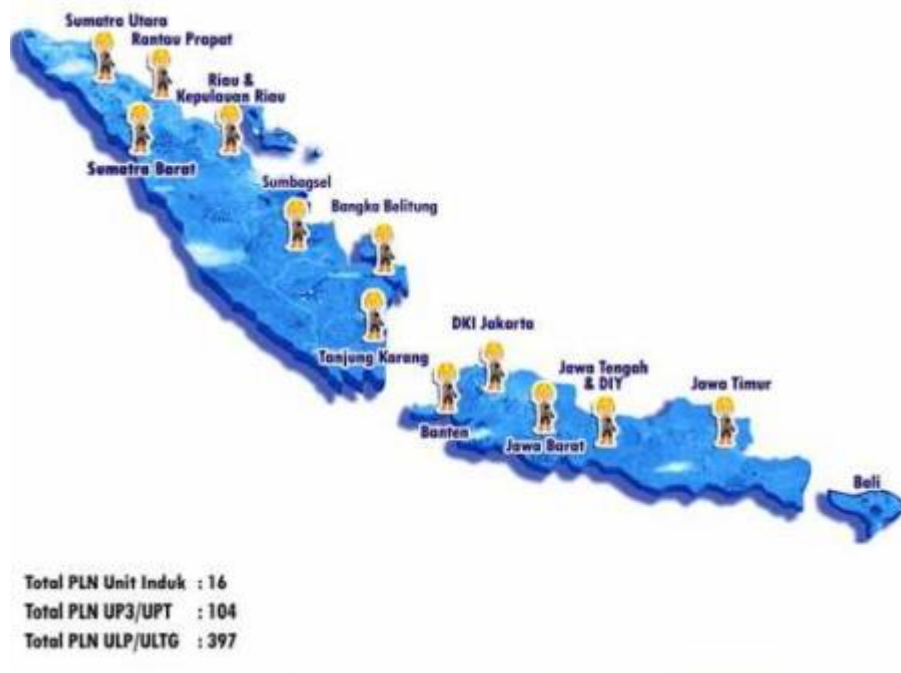
Gambar 1.3 Ruang Lingkup Perusahaan