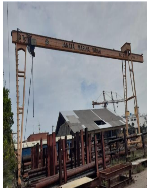
Gambar 1.11 Gantry Crane