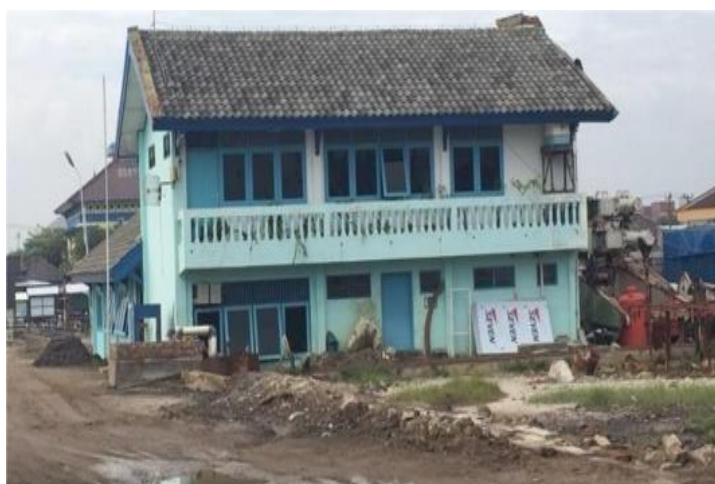
Gambar 1.6 Kantor Utama JMI