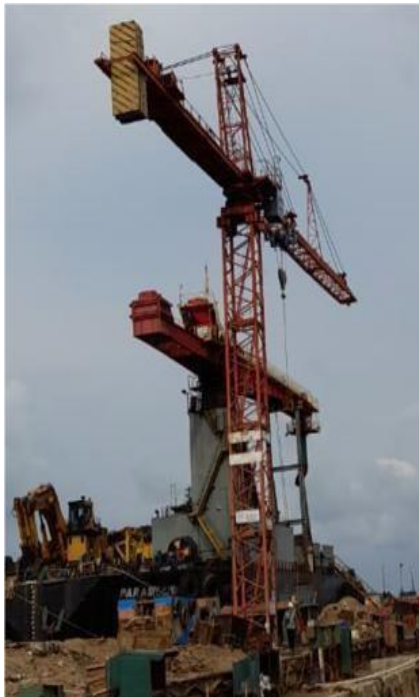
Gambar 1.10 Tower Crane