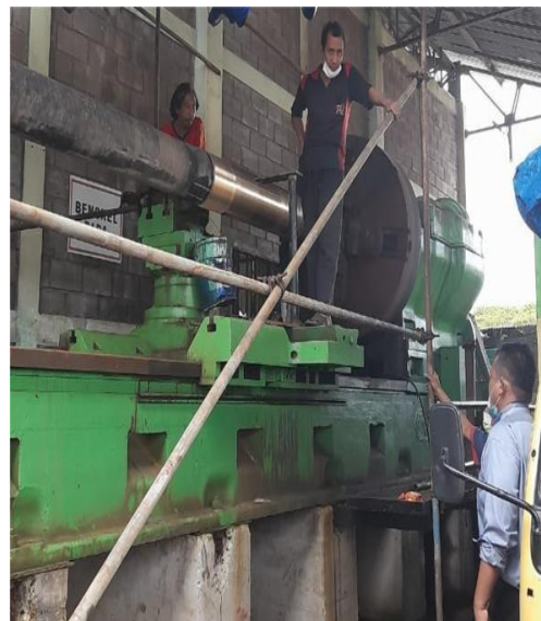
Gambar 1.17 Bengkel Mesin