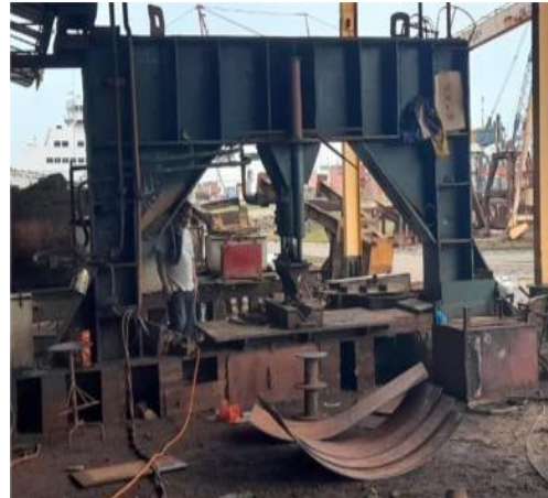
Gambar 1.13 Mesin Bending