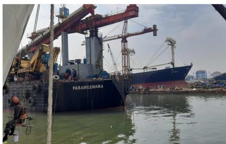
Gambar 1.8 Graving Doc