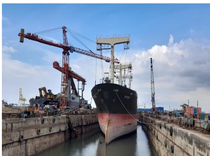
Gambar 1.7 Floating Quay