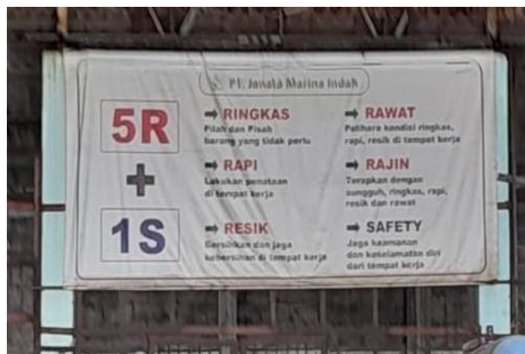
Gambar 1.4 Budaya Kerja 5R+1S