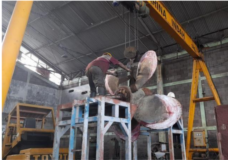
Gambar 1.18 Bengkel Outfiti