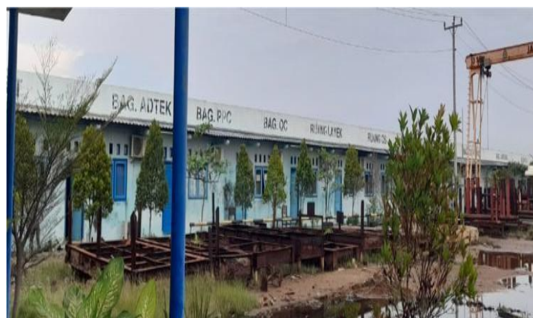
Gambar 1.5 kantor bagian