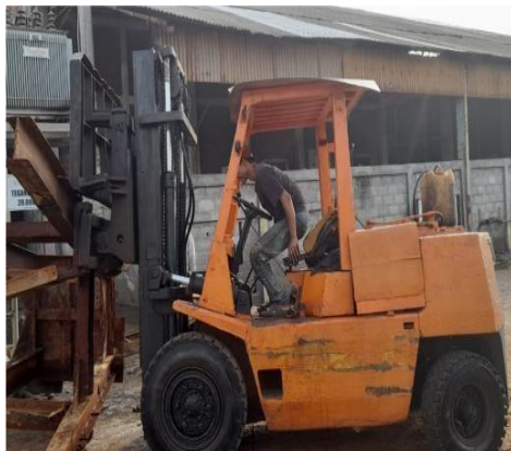
Gambar 1.14 Forklif