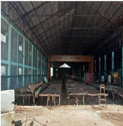
Gambar 1.16 Bengkel Febrikasi