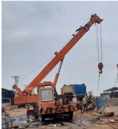
Gambar 1.12 Mobil Crane