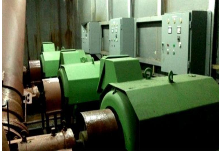
Gambar 1.9 Motor Pompa Graving Dock