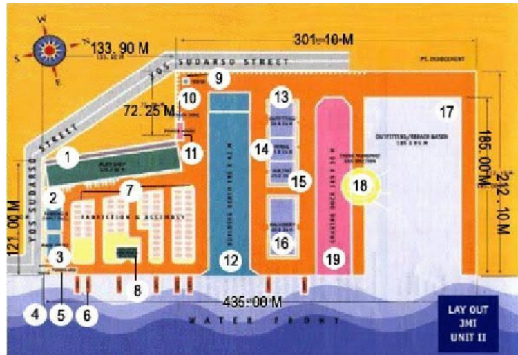
Gambar 1.3 Lay Out JMI Unit II Versi Warna