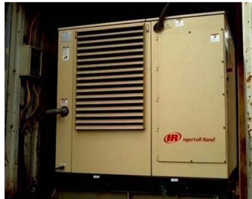
Gambar 1.15 Elektrik Air Compressor