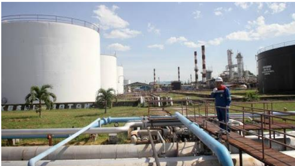
Gambar 1.1 Kilang Produksi PT. Pertamina Sei Pakning Sumber, PT. Pertamina RU II Sei Pakning

Pada awal operasi kilang, kapasitas pengolahannya, baru mencapai 25.000 barel perhari. Pada bulan September 1975, seluruh operasi kilang beralih dari Reficen kepada pihak Pertamina. Semenjak itu kilang mulai menjalani penyempurnaan secara bertahap sehingga, produk dan kapasitasnya dapat ditingkatkan lagi menjelang akhir tahun 1977, kapasitas kilang meningkat menjadi 35.000 barel perhari. Mencapai 40.000 barel pada tahun April 1980. Dan sejak tahun 1982, kapasitas kilang menjadi 50.000 barel perhari, sesuai kapasitas terpasang.