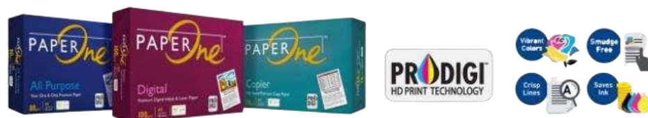
Gambar 1.5 Produk PT. Riau Andalan Pulp and Paper

PT. Riau Andalan kertas atau yang lebih dikenal dengan Riau Paper merupakan pabrik pembuatan kertas, yang memproduksi kertas photocopy dan uncoated wood free bergramatur 50 gsm sampai 120 gsm dengan menggunakan dua unit mesin kertas berteknologi terkini dan berkecepatan tinggi. Kertas yang dihasilkan oleh Riau paper dipasarkan dalam bentuk Cut Size , Folio Sheeter maupun gulungan ( Roll ), dengan merek dagang yang telah dikeluarkan seperti Paper One , Copy Paper dan Dunia Mas .