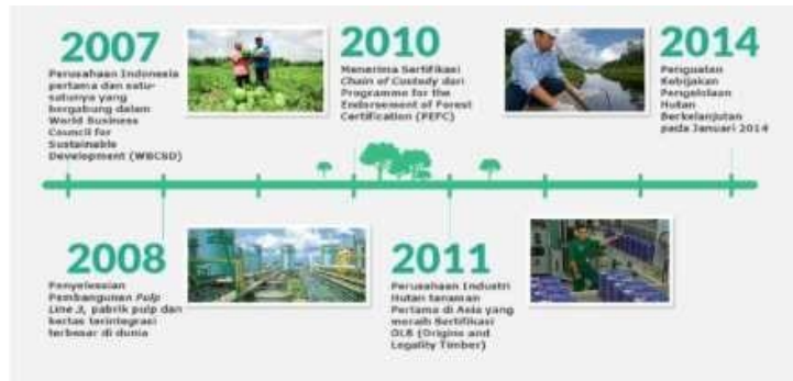
Gambar 1.3 Perkembangan PT. Riau Andalan Pulp and Paper Tahun 2007 – 2011

Pada tahun 2006, APRIL ikut menjadi salah satu penandatangan Prinsip-Prinsip Perjanjian Global PBB. Di tahun yang sama, PT Riau Andalan Pulp & Paper sebagai anak perusahaan dari APRIL, disertifikasi untuk Pengelolaan Hutan Tanaman Berkelanjutan berdasarkan standar Lembaga Ekolabel Indonesia (LEI).