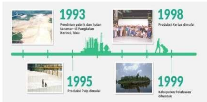
Gambar 1.1 Perkembangan PT. Riau Andalan Pulp and Paper Tahun 1993 – 1999

Sebagai salah satu pelopor perusahaan yang bertanggung jawab, APRIL dan anak perusahaannya melaksanakan prinsip 5C yang dipercaya oleh Bapak Sukanto Tanoto. Praktek bisnis harus membawa kebaikan bagi Masyarakat ( Community ), Negara ( Country ), Iklim ( Climate ), Pelanggan ( Customer ) dan pada akhirnya baik bagi Perusahaan ( Company ). Dengan demikian, tanggung jawab sosial perusahaan diaplikasikan dalam operasional dan manajemen APRIL untuk memajukan lingkungan dan mengembangkan masyarakat serta untuk memenuhi tanggung jawab sosial korporasi. Tanoto Foundation yang didirikan pada tahun 1981 merupakan penerapan visi ini.