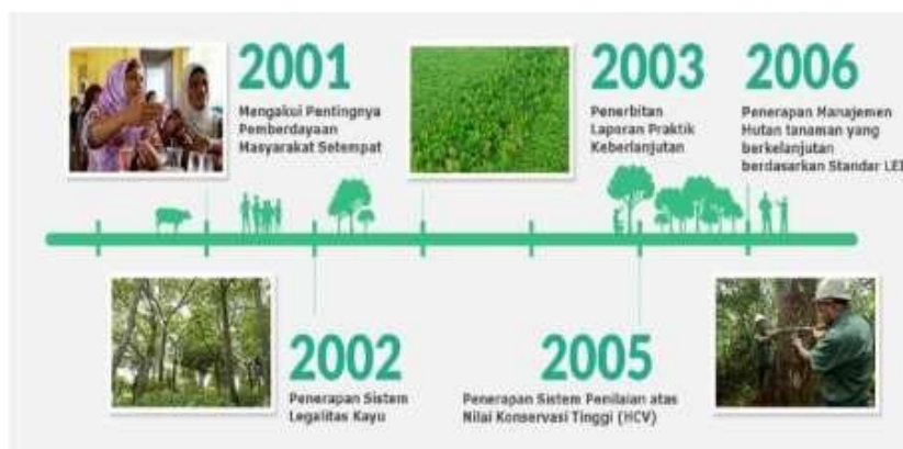
Gambar 1.2 Perkembangan PT. Riau Andalan Pulp and Paper Tahun 2001 - 2005

Pada tahun 2010, kegiatan operasional kehutanan APRIL memberikan kontribusi sebesar 6,9 persen pada total perekonomian Provinsi Riau. APRIL telah menciptakan sekitar 90.000 lapangan kerja bagi masyarakat. APRIL juga berkontribusi terhadap pemberian akses yang lebih baik pada pendidikan dan dukungan sosial di berbagai bidang seperti perawatan kesehatan dan perumahan. APRIL telah membantu meningkatkan standar hidup dan menurunkan tingkat kemiskinan sebesar 30 persen.