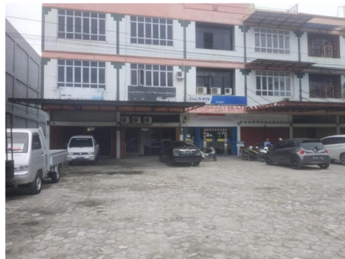
Gambar 1.1 : Lokasi kantor Pusat CV. TUGU MAS & CO di Jl. Soekarno-Hatta Pekanbaru

CV. TUGU MAS & CO di dirikan berdasarkan akte notaris Tito Utoyo.,SH pada tanggal 8 April 2011 dan izin Kementrian Hukum dan Hak Asasi Manusia RI Nomor: M-22 – HT 03 01 – Th. 1990. Tanggal 7 juli 1990.