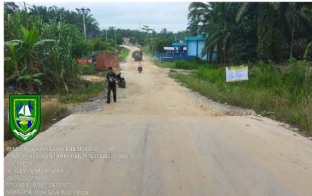
Gambar 1.1 Jalan Tasik Serai Sebelum Peningkatan Sumber: Dokumentasi lapangan