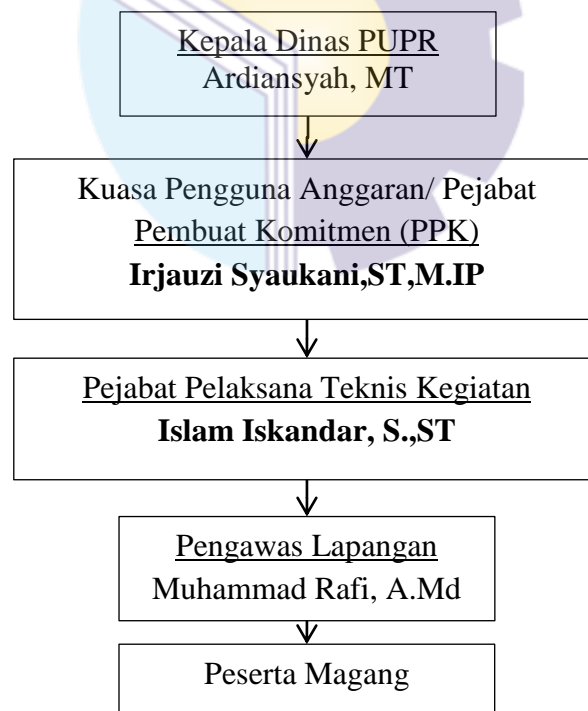
Gambar 1. 3 Struktur Organisasi Proyek

Untuk mendapatkan komunikasi dilokasi proyek, maka hal yang perlu diketahui adalah struktur organisasi riil di lapangan. Adapaun struktur organisasinya sebagai berikut.