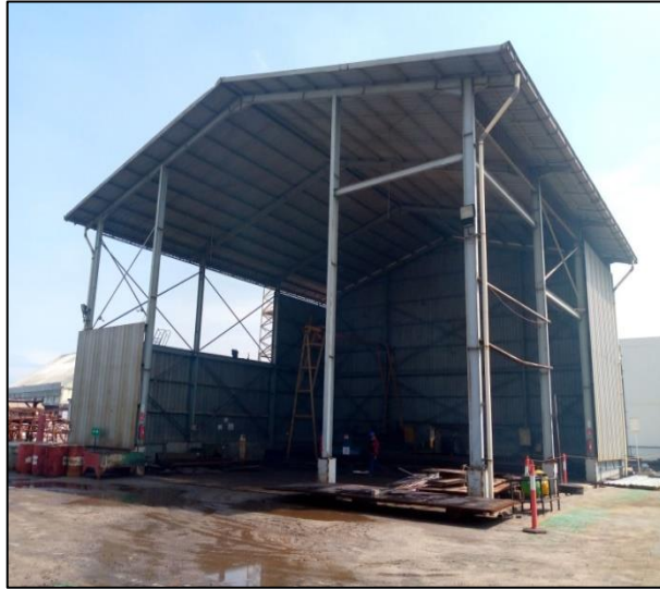
Gambar 1.4 Workshop CNC PT. Yasa Wahana Tirta Samudera.