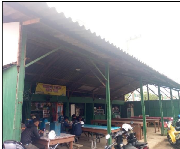
Gambar 1.14 Kantin di PT. Yasa Wahana Tirta Samudera.

Tempat untuk istirahat dan makan siang semua karyawan PT Yasa Wahana Tirta Samudera.