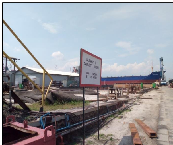
Gambar 1.6 Slipway D PT. Yasa Wahana Tirta Samudera.