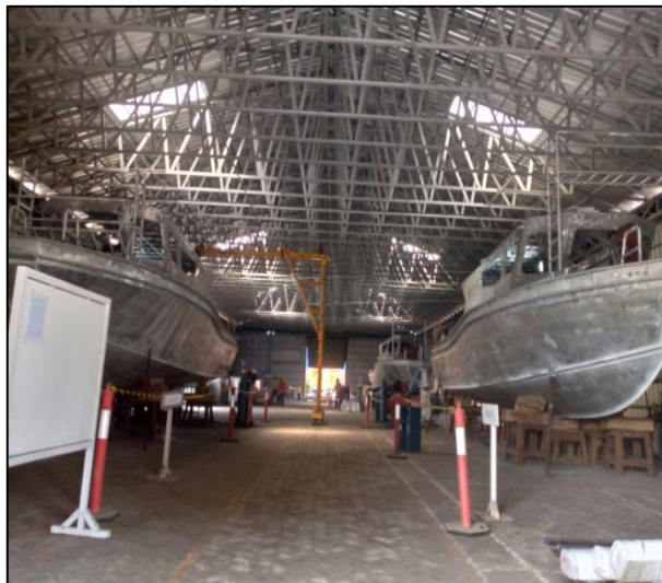
Gambar 1.9 Area Building Berth PT. Yasa Wahana Tirta Samudera.

Berth Building Berth merupakan tempat untuk pembuatan kapal baru. Luas area ini 60 m x 17 m.