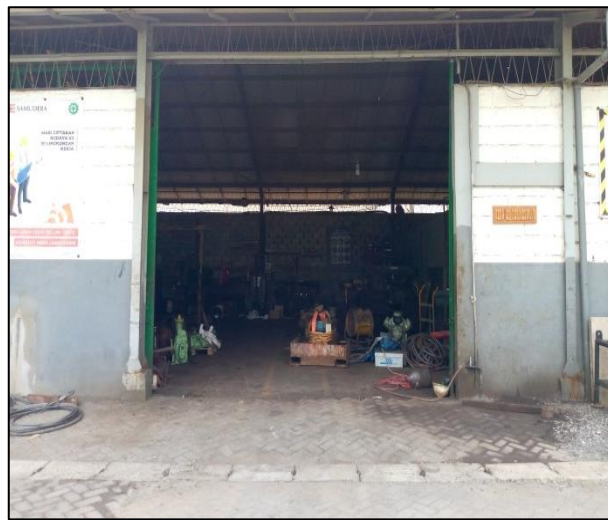
Gambar 1.3 Workshop PT. Yasa Wahana Tirta Samudera.

Di ruang ini terdapat 6 alat yaitu: 2 mesin bubut besar dan kecil, 2 mesin bor besar dan kecil, 1 mesin frais, dan 1 mesin sekrap. Mesin bubut besar yang ada di sini biasa digunakan untuk pengerjaan shaft dengan maksimal diameter 300 mm dan panjang 8 m. Mesin bubut kecil biasanya untuk membuat drat pada pipa, baut, dll. Pada workshop juga sering dikerjakan berbagai pekerjaan yang berhubungan dengan rudder, propeller, dan juga shaft kapal. Selain itu juga terdapat ruangan semi terbuka untuk pengerjaan pipa dan valve.