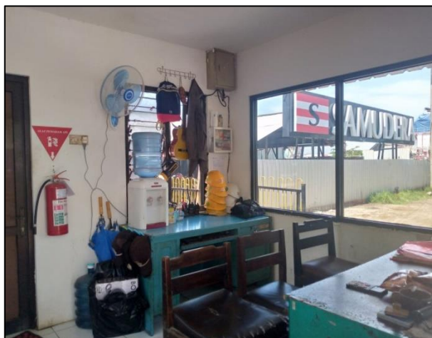
Gambar 1.12 Pos Security PT. Yasa Wahana Tirta Samudera.

Dimana fasilitas ini berperan untuk menjaga keamanan di dalam perusahaan agar tidak terjadi hal yang tidak diinginkan pengunjung dan karyawan yang masuk maupun keluar selalu di periksa oleh security sehingga untuk barang barang yang tidak perlu dibawa kedalam diamankan dan setelah keluar di periksa kembali.