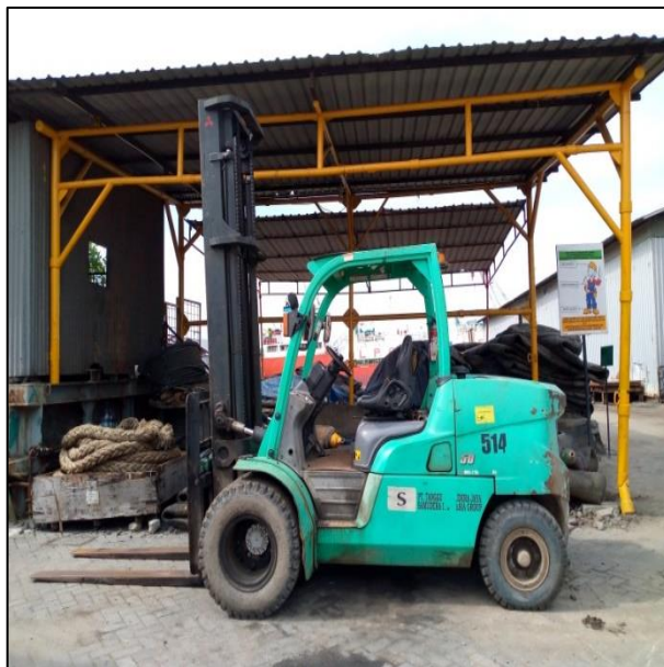
Gambar 1.19 Forklift di PT. Yasa Wahana Tirta Samudera.

Forklift digunakan untuk mengangkat dan memindahkan barang yang tidak terlalu berat.