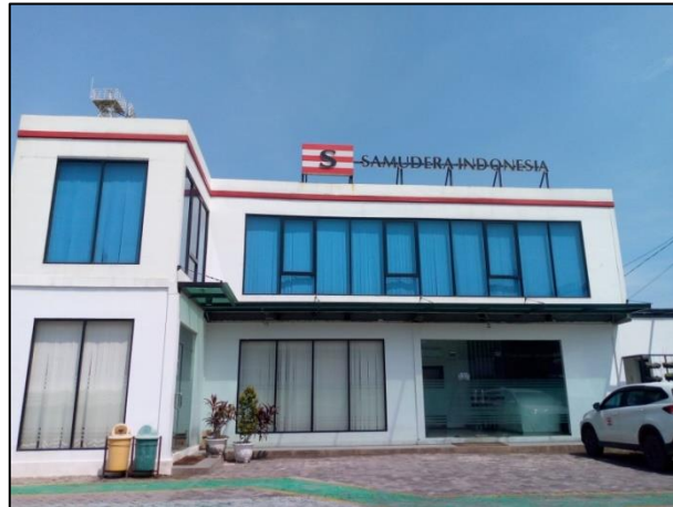
Gambar 1.1 kantor unit satu PT. Yasa Wahana Tirta Samudera.