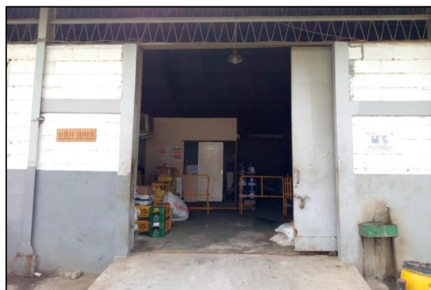
Gambar 1.2 Gudang PT. Yasa Wahana Tirta Samudera.

Gudang berfungsi untuk penyimpanan material untuk pengerjaan kapal baik itu material perusahaan atau material titipan owner , serta sebagai tempat untuk mengatur keluar masuk barang proyek perusahaan. Di gudang terdapat barang-barang seperti LPG, cat, mur, baut, plat tipis, CO2, dll. Gudang harus menyediakan kebutuhan untuk 3 bulan kedepan. Untuk pengambilan material, subkon yang mengambil barang yang dibutuhkan biasanya membawa nota yang ditanda – tangani oleh orang produksi untuk diserahkan ke orang gudang. Sehingga setelah barang diambil dapat di data, dan jelas pengeluarannya untuk apa – apa saja.