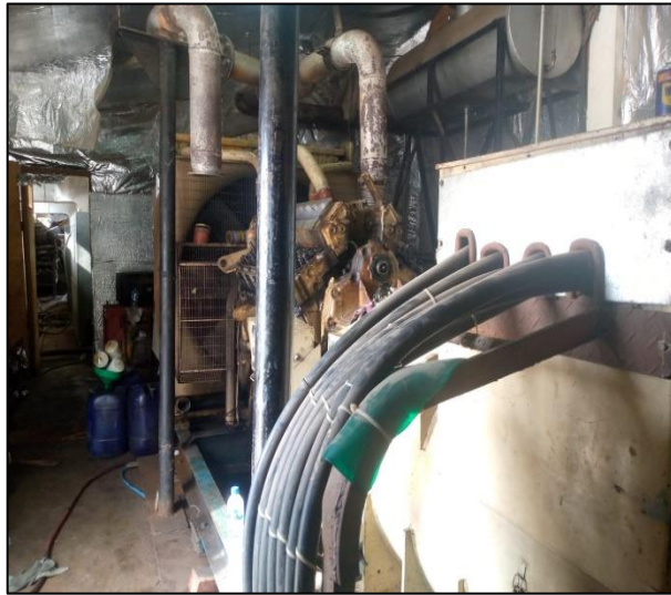
Gambar 1.10 Kelistrikan PT. Yasa Wahana Tirta Samudera.

Dalam proses produksi dan reparasi dalam perusahaan, tenaga listrik di PT Yasa Wahana Tirta menggunakan Sumber listrik dari PLN digunakan untuk semua keperluan, mencakup keperluan kantor dan proses produksi di dalam bengkel maupun sebagai penyuplai listrik akomodasi kapal disaat docking dan memiliki daya 1 x 345 KVA dengan pemakaian 22.000 watt. Diesel Engine (Generator Set) Sumber listrik dari diesel digunakan untuk menunjang kegiatan produksi disaat listrik dari PLN sedang turun. Genset ini mempunyai daya 250 KVA – 750 KVA.