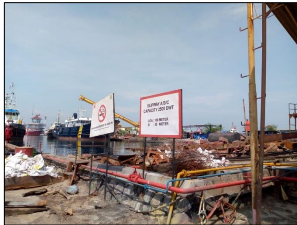
Gambar 1.5 Slipway A,B dan C PT. Yasa Wahana Tirta Samudera.

Area Slipway E Di slipway E pendedokan menggunakan metode air bag sistem, dengan kapasitas 2000 DWT. Panjang air bag 12m dengan diameter 1,5m atau 1,8m. Luas area slipway E 70m x 24m.