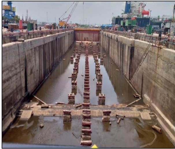
Gambar 1.8 Graving Dock PT. Yasa Wahana Tirta Samudera.