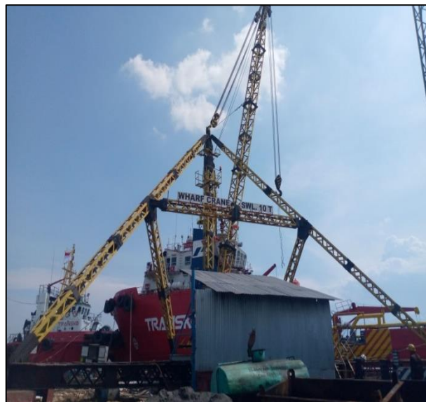
Gambar 1.17 Crane di PT. Yasa Wahana Tirta Samudera.

Crane merupakan salah satu pesawat pengangkat dan pemindah material yang banyak di gunakan. Crane juga merupakan mesin alat berat ( heavy equipment ) yang memiliki bentuk dan kemampuan angkat yang besar dan mampu berputar hingga 360 derajat dan jangkauan hingga puluhan meter. Crane biasanya digunakan dalam pekerjaan pekerjaan proyek, pelabuhan, perbengkelan, industri, pergudangan dll. PT. Yasa Wahana Tirta Samudera memiliki beberapa crane dengan ukuran 25T, 5T, 5T, dll.