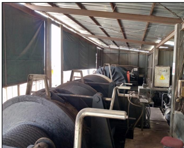
Gambar 1.16 Winch di PT. Yasa Wahana Tirta Samudera.

Winch merupakan sebuah alat yang digunakan untuk menarik kapal ke atas daratan pada slipway yang digerakkan oleh motor hidrolis. Tali pada winch nantinya akan diikatkan pada kapal dan winch tersebut akan memutar dengan gerakan motor.