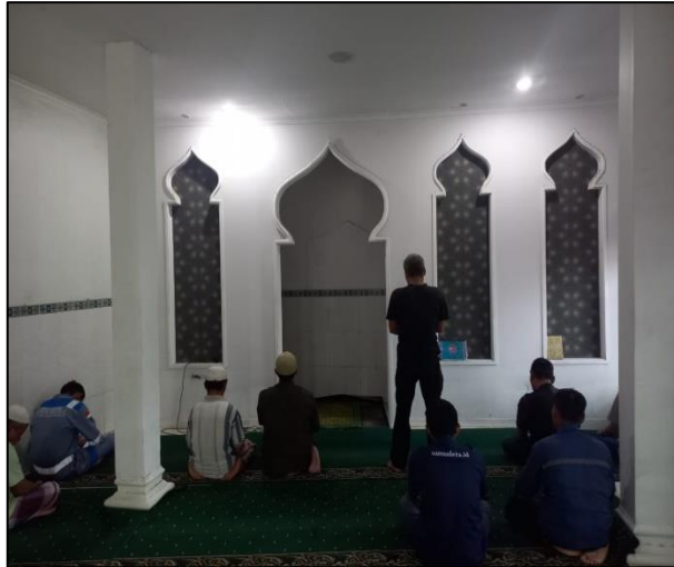
Gambar 1.13 Mushola PT. Yasa Wahana Tirta Samudera.

Digunakan untuk sholat para karyawan PT Yasa Wahana Tirta Samudera.