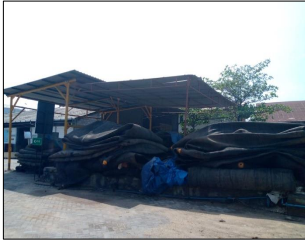
Gambar 1.15 Airbag di PT. Yasa Wahana Tirta Samudera.

Airbag merupakan bantalan udara yang digunakan untuk memudahkan kapal bergerak di daratan sebelum akhirnya diletakkan pada stop block .