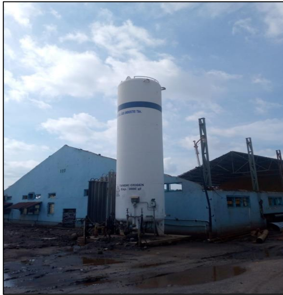
Gambar 1.11 Kompresor PT. Yasa Wahana Tirta Samudera.