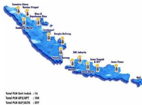
Gambar 1.1. Ruang Lingkup Perusahaan

ditugaskan untuk mendukung layanan operasi dan pemeliharaan bidang transmisi dan distribusi tenaga listrik, bekerja sama dengan unit-unit PLN Wilayah melalui Keputusan Direksi No. 459. K/DIR/2012 tertanggal 14 September 2012, tentang Pengamanan Layanan Operasi dan Pemeliharaan Transmisi dan Distribusi Ketenaga listrikan.