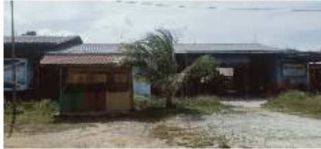
Gambar1.1 PT.Megapower Makmur Tbk.