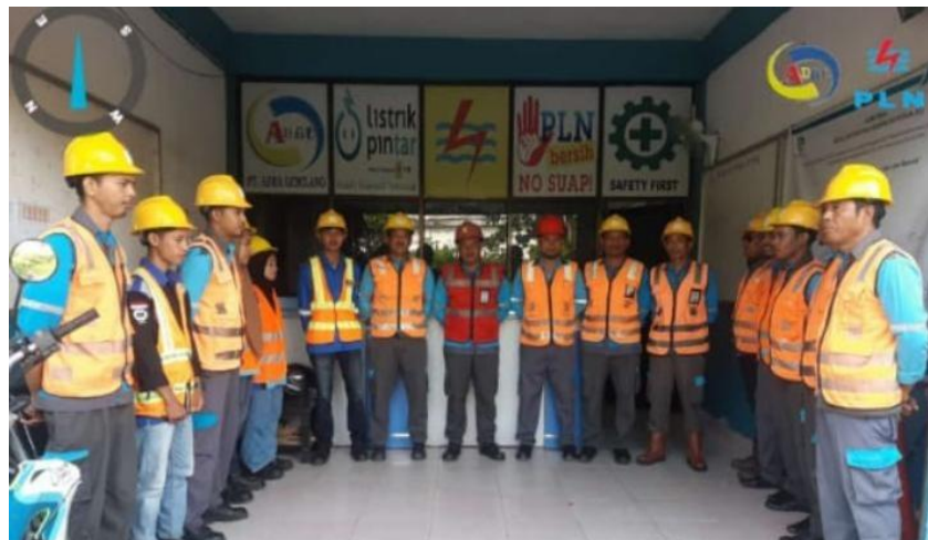
Gambar 1. 1 PT.Adra Gemilang

Mengingat tenaga listrik sangat penting bagi peningkatan kesejahteraan dan kemakmuran rakyat secara umum serta untuk mendorong peningkatan ekonomi masyarakat secara khusus, dan oleh karena itu usaha penyediaan tenaga listrik, pemanfaatan dan pengelolanya perlu ditingkatkan agar tersedia tenaga tenaga listrik dalam jumlah yang cukup merata dengan mutu pelayanan yang baik. Kemudian dalam rangka peningkatan pembangunan yang berkesinambungan diperlukan upaya-upaya.