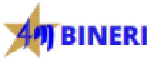
Gambar 1. 1 Logo PT.Bintang Empat Mandiri

Logo PT. Bintang Empat Mandiri tidak mengalami perubahan dari mulai pertama kali dibangun pertengahan Desember 2018 hingga sekarang. Berikut logonya: