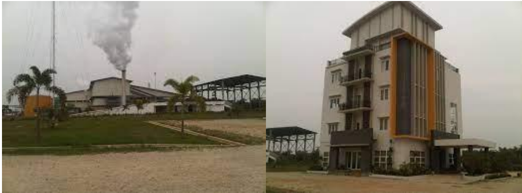
Gambar 2.1 PT. Meskom Agro Sarimas