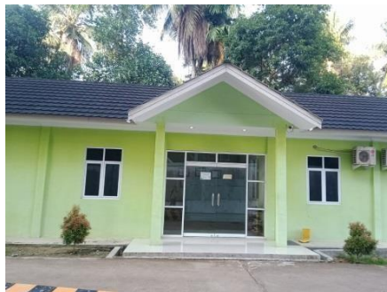
Gambar 1.1 Kantor perusahaan PT. Rimba palma sejahtera lestari