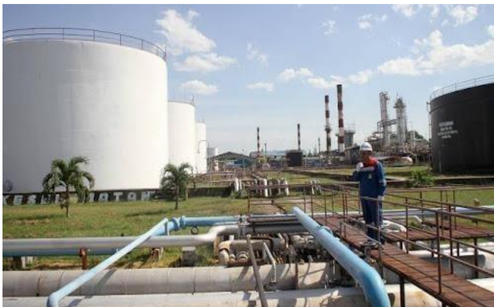
Gambar 1. 1 Kilang Produksi PT. PERTAMINA RU II Sei Pakning

Menjelang akhir tahun 1977, kapasitas kilang meningkat menjadi 35.000 barel perhari. Mencapai 40.000 barel pada tahun April 1980. Dan sejak tahun 1982, kapasitas kilang menjadi 50.000 barel perhari, sesuai kapasitas terpasang.