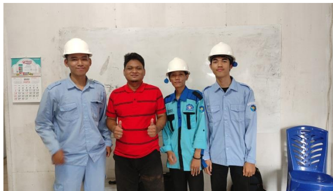
Gambar 1. 1 PT.Bintang Empat Mandiri

PT Bintang Empat Mandiri didirikan dengan tujuan untuk memberikan pelayanan dan solusi terbaik kepada semua mitra bisnis PT Bintang Empat Mandiri, dalam menghadapi dan memecahkan masalah, untuk hasil yang aman, produktif, efektif dan efisien.