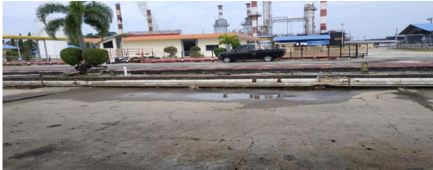
Gambar 1.2. Produksi BBM RU II Sungai Pakning