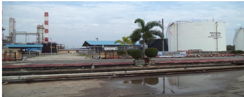
Gambar 1.1. Kilang Minyak PT. Pertamina RU II Sungai Pakning

Kilang Produksi BBM RU II Sungai Pakning adalah bagian dari Pertamina RU II Dumai yang merupakan kilang minyak dari business Group (BG) Pengolahan Pertamina. Tenaga kerja yang mendukung kegiatan kilang RU II Sungai Pakning adalah 207 pekerja Pertamina dan 61 pekerja jpk (Jasa Pemeliharaan Kilang). Kilang produksi BBM Sungai Pakning dengan kapasitas terpasang 50.000 barel perhari di bangun tahun 1968 oleh Refining Associates Canada Ltd (Refican) diatas tanah seluas 280 Ha, selesai tahun 1969 dan beroperasi pada bulan Desember 1969. Pada awal operasi kilang, kapasitas pengolahannya baru mencapai 25.000 Barel perhari, pada Bulan September 1975 seluruh operasi kilang beralih dari Rafican kepada pihak Pertamina. Semenjak itu kilang mulai menjalani penyempurnaan secara bertahap, sehingga produk dan kapasitasnya dapat di tingkatkan lagi.