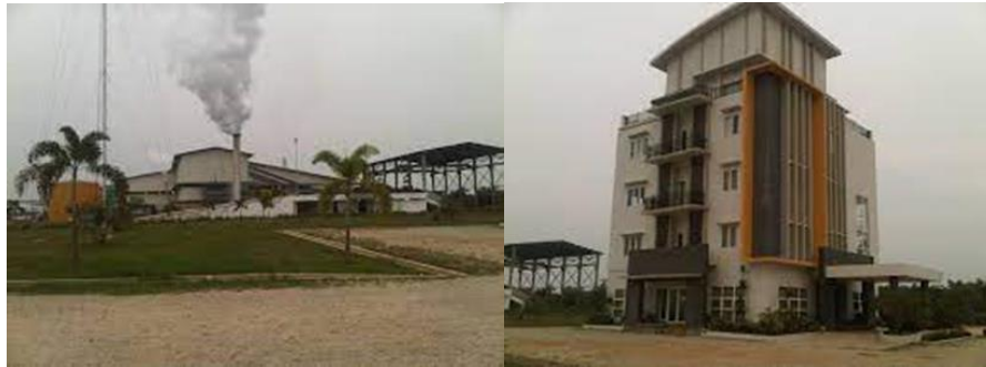
Gambar 1. 1 PT Meskom Agro Sarimas

Adapun data perizinan yang dimiliki untuk membangun perusahaan PT Meskom agro sarimas adalah sebagai berikut: