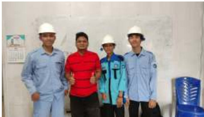
Gambar 1.1 PT. Bintang Empat Mandiri

Tujuan PT. Bintang Empat Mandiri adalah untuk memberikan pelayanan dan solusi terbaik kepada semua mitra bisnis dalam menghadapi dan memecahkan masalah, hasil yang aman, produktif, efektif, dan efisien. PT. Bintang Empat Mandiri juga menyediakan jasa konsultasi, pengadaan material, engineering process, functiontest commissioning, trouble shooting, dan maintenance yang didukung oleh team work yang kompeten dan profesional.