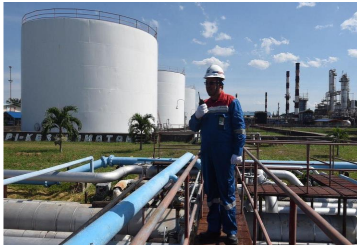
Gambar 1. 1 Kilang Produksi PT. Pertamina Sei. Pakning

Menjelang akhir tahun 1977, kapasitas kilang meningkat menjadi 35.000 barel perhari. Mencapai 40.000 barel padatahun April 1980. Dan sejak tahun 1982, kapasitas kilang menjadi 50.000 barel perhari, sesuai kapasitas terpasang.