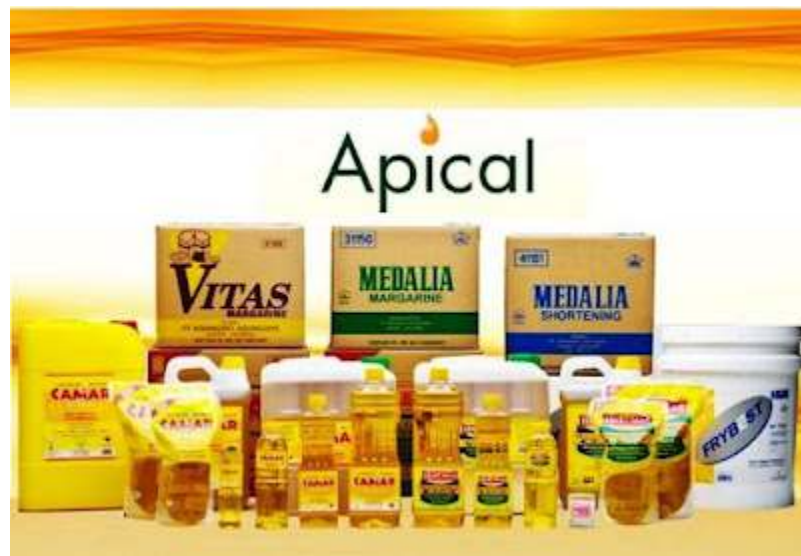
Gambar 1.1 Produk utama Apical Group

Adapun produk utama dari Apical Group dapat di lihat pada gambar berikut ini: