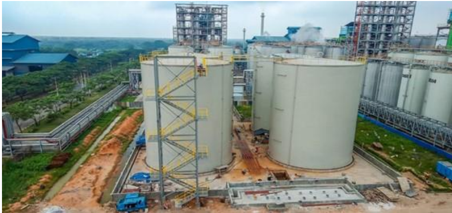
Gambar 1.2 : Kawasan PT.Wilmar Nabati Dumai Pelitung

PT WINA telah mampu mengolah Crude Palm Oil (CPO) sebesar 4.100 MT perharinya dan Palm Kernel (PK) Crushing sebanyak 1000 MT perharinya yang menjadikan PT. WINA sebagai produsen dan pengeksport minyak sawit terbesar di Indonesia. Perkembangan lain yang dilakukan oleh manajemen PT.WINA yaitu pada awal tahun 2005 kembali membangun pabrik di kawasan industri Dumai-Pelitung berupa pembangunan refinery fractionation dengan kapasitas 5.600 MTD dan PK crushing plant dengan kapasitas 1500 TPD. Adapun perkembangan pabrik ini didukung dengan pelabuhan yang mempunyai dermaga dengan panjang 425 meter dan kolom pelabuhan dengan kedalaman 14 meter, yang dapat disandari oleh kapal dengan bobot 50.000 DWT dan akan dikembangkan untuk dapat disandari kapal 70.000 DWT yang merupakan perusahaan yang berada dalam satu naungan Wilmar Group. Komitmen yang tinggi dari manajemen dan karyawannya memungkinkan PT WINA untuk berkembang lebih besar lagi. Hal ini terbukti dengan telah diperolehnya sertifikat ISO 9001:2008 pada tanggal 16 oktober 2009. Dalam menjalankan operasional perusahaan, manajemen PT WINA telah menetapkan suatu visi dan misi yaitu mendukung bisnis operasional group sehingga tercapai kapasitas yang optimal dan kualitas yang sesuai dengan permintaan pelanggan serta waktu pengiriman yang tepat dengan cara pengembangan kinerja sumber daya manusia yang ada. Pada tahun 2009, nama PT WINA berubah menjadi PT Wilmar Nabati Indonesia sebagai wujud perkembangan usaha yang semakin besar dan