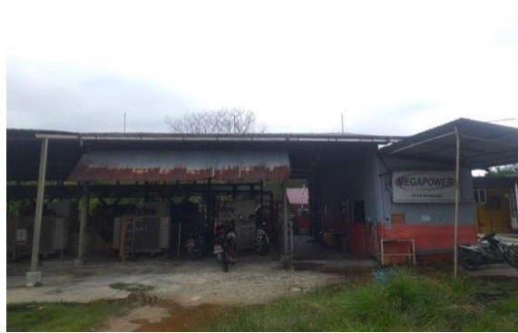
Gambar 1. 1 PT. Megapower Makmur Tbk.