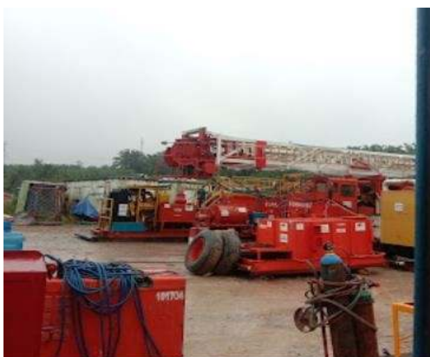
Gambar 1. 1 PT. Bohai Drilling Service Indonesia